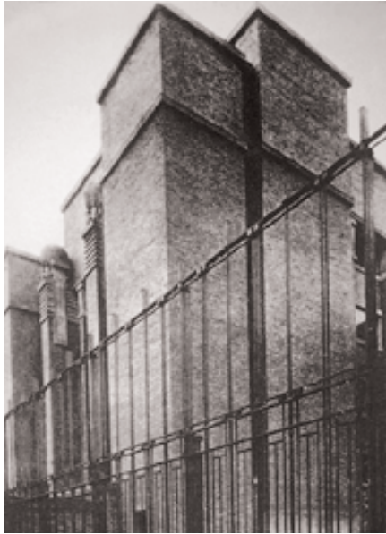
Fig. 9. F. Ll. Wright. Larkin Building .

Los tiempos modernos que comienzan, por así decir, con la revolución a finales del siglo dieciocho, han generado exigencias y tendencias absolutamente diferentes. Las ciencias, las investigaciones de todo género, el comercio, la locomoción han sido las fuerzas motrices de la época. Así los edificios y las construcciones del siglo diecinueve han sido llamados a resolver exigencias nuevas. Desde este punto de vista, las obras del ingeniero responden más sinceramente al espíritu de nuestro tiempo, es decir las estaciones, los ferrocarriles, los puentes, los barcos y las máquinas de vapor, las aplicaciones científicas de todo género.