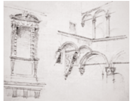
Fig. 3. Hendrik Petrus Berlage. Apuntes de viaje a Italia.

Mientras la discusión se enredaba, Berlage, superando las minucias en las que otros se detuvieron, incluido su compatriota Cuypers, que se enredó en una interminable casuística de enumeración de materiales y de usos más adecuados para cada uno de ellos 15 , supo plantear el problema en sus dimensiones verdaderas: “como carecemos de un estilo moderno, me atrevo a decirlo, la construcción futura tendrá la influencia suficiente para llegar a ser el punto de arranque de un nuevo estilo”.