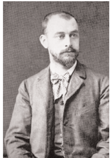
Fig. 1. Hendrik Petrus Berlage.

Pero a pesar de esto, y aun prescindiendo de que el contenido de los textos es interesante por sí mismo, como apuntaremos, desde un punto de vista puramente histórico, merece la pena conocerlos aunque sólo sea para saber qué dijeron Muthesius y Berlage en Madrid en 1904, durante su única estancia conocida en España, al margen de que después podamos atribuirles (o no) alguna influencia en el desarrollo posterior de la arquitectura española; que entonces deambula-