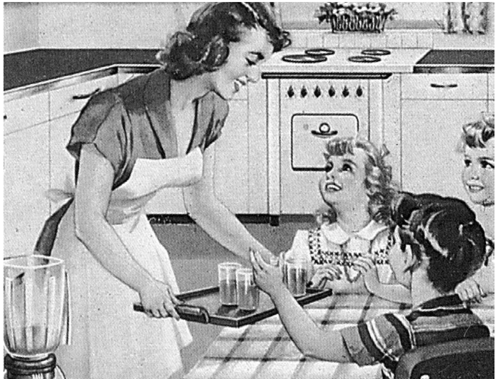
Fig. 2. La italiana CGE (Compagnia Generale di Elettricità) publicita los nuevos electrodomésticos para el hogar, en La Cucina Italiana , 1954.

A la influencia de esos modelos, que alimentaron y resolvieron el afán de novedad y de puesta al día que animaba a nuestros arquitectos, debemos en buena medida algunos de los mejores logros alcanzados por aquellos jóvenes entusiastas, que luchaban en los cincuenta por asimilar e interpretar con urgencia todo lo que la arquitectura internacional había producido en la primera mitad del siglo XX.