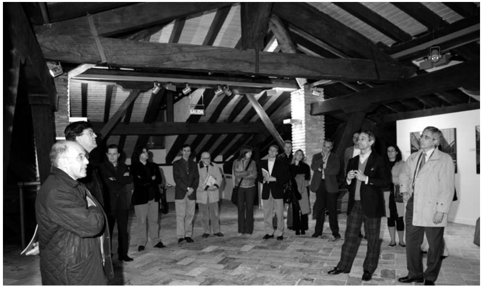
Fig. 5. Inauguración de la Exposición 38 fotografías para retratar los cincuenta , en la Sala de Armas de la Ciudadela de Pamplona.