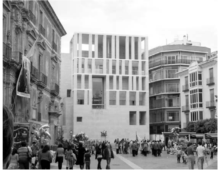
Fig. 1. Gobierno Civil de Tarragona. Alejandro de la Sota. (Fotografía Santiago Castorina. www.flickr.com).