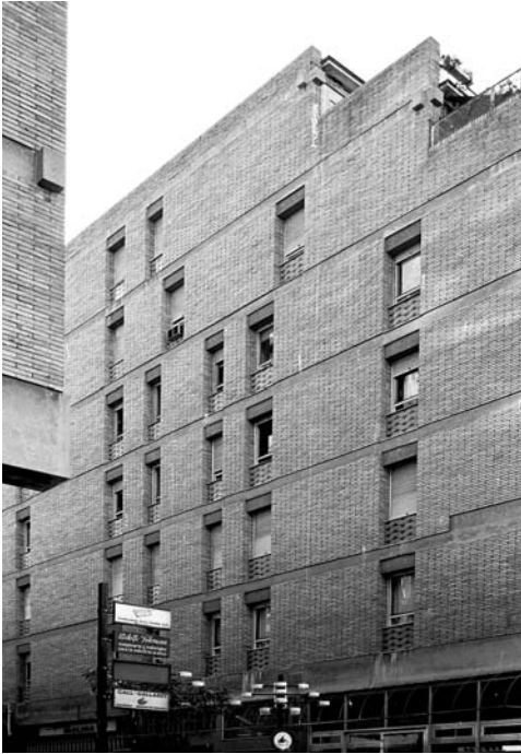
Fig. 5. Edificio de viviendas en la Via Augusta/Brusi/Sant Elies, Barcelona, 1964. Antoni de Moragas. (www.flickr.com).