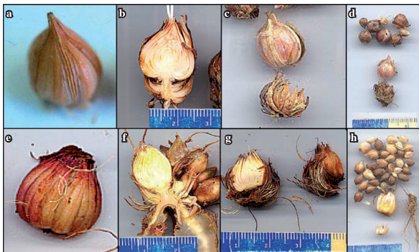
Figura 4. Características de las formas de Oxalis latifolia II. Arriba, forma common , de izquierda a derecha: escamas con 3-5 nervios prominentes, color blanco-rosado de las escamas interiores, restos del bulbo parental enteros y productividad; abajo, forma cornwall , de izquierda a derecha, escamas con 1-3 nervios no prominentes, color amarillento de las escamas interiores y restos del bulbo parental en forma de haces deshilachados y productividad. Pamplona, España; a y e, marzo de 2001; b, c, f y g, noviembre de 2001; d y h, noviembre de 2001.

Para Young (1958), estas dos formas no son más que clones diferentes de la misma especie que fueron introducidas como especies ornamentales y que, según Robb (1963), fuera de su lugar de origen, sólo en muy contadas ocasiones han producido frutos y semillas. Al haberse multiplicado los bulbos principalmente por medios vegetativos, las diferencias iniciales se han ido manteniendo a lo largo de los años.