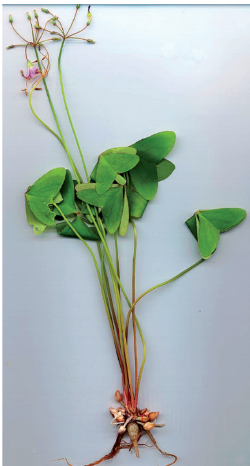
Figura 2. Oxalis latifolia forma common, con actividad vegetativa. Pamplona, España, Julio, 2002.

Durante el mencionado crecimiento estival, uno, dos o, raramente, tres raíces se engruesan, adquiriendo un aspecto napiforme, color grisáceo y algo translúcido (Figura 2). Esta raíz tuberosa no contiene almidón, sino azúcares reductores (Robb 1963). Según Estelita-Teixeira (1977) todas las raíces tuberosas se contraen intensamente empezando en las proximidades del tallo. Dicha raíz solamente se desarrolla cuando el bulbo está ubicado cerca de la superficie (López