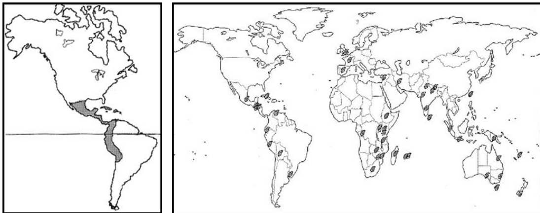
Figura 1. Distribución de Oxalis latifolia . Izquierda, área aproximada de distribución natural de O. latifolia ; derecha, según HOLM et al. (1997), distribución mundial de Oxalis latifolia como mala hierba.

el tipo conservado en el herbario de Humboldt), Bermudas, Bahamas, Costa Rica, Haití, Martinica, Colombia, Venezuela, Ecuador y Perú. Lourteig (1980) amplía su área de distribución natural hasta Bolivia (Figura 1, izq.). Naturalizada como mala hierba de cultivos, Young (1958) la menciona en muchas partes del mundo -región mediterránea, islas Británicas, Ceilán y Sudáfrica-; Jehlik (1995) en Centroeuropa; Holm et al. (1997) la cita en los montes Himalayas de la India, en el este de África, incluidas Madagascar y las islas Mauricio, Uruguay, Taiwan, Indonesia y Oceanía -Nueva Guinea, Australia, Tasmania y Nueva Zelanda -; Lourteig (1980), en el sur de Brasil; y Nunes-Vidal et al. (1987), de Argentina. En Sudamérica se le conoce desde el nivel del mar hasta los 3.300 m según el Herbario Nacional de Ecuador (Ecuador, Provincia Pichincha, Reserva Geobotánica Pululahua, 00°05'N 78°30'W, pliego n°2571, QCNE). Según la descripción ecológica de uno de los pliegos consultados en la Pontificia Universidad Católica del Ecuador, procedente de Veracruz, México, "es una planta que aparece en los bosques caducifolios secundarios, sobre suelo café arcilloso y arenoso; suele aparecer en potreros" (México, Veracruz, Municipio Xalapa, granja Guadalupe, 19°30'N 96°55'W, 08-11-1979, determinado por G. Castillo L., referencia 61450, QCA). La Figura 1 (derecha), de Holm et al. (1997), muestra la distribución mundial de Oxalis latifolia como mala hierba.