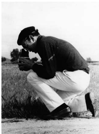
Joaquín del Palacio, Kindel, 1971

lectivo de la arquitectura moderna de mediados de siglo XX en España. Kindel realizó, entre otros, extensos reportajes para la principal revista de arquitectura de España en la década de 1950: RNA Revista Nacional de Arquitectura, consolidándose como su principal fotógrafo. Por tanto, la visión de la arquitectura desde su cámara se convirtió en el estandarte canónico de su representación, aportando una perspectiva fresca y moderna, a la vez que delicadamente poética. 1 Como José Luis Fernández del Amo sugirió una vez, Kindel “nos ha traído todo eso que no se exhibe, lo que ofrece en secreto la oculta