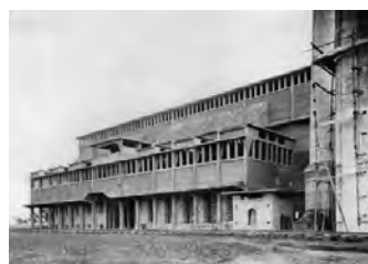
Hermanos Rank, Fábrica de gas para la Catalana de Gas y Electricidad, Sevilla 1912-14.