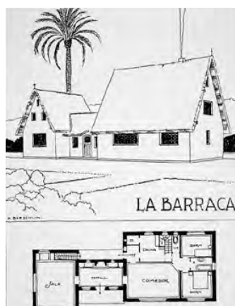
Alfredo Baeschlin, “Casas de campo españolas”, 1930: “la barraca”.

El programa de las casas de campo proyectadas por Baeschlin era explícito: garage, hall, sala, salón, cuartos para la doncella y el chófer... Obviamente, se trataba de objetos de representación de una burguesía emergente y de sus plusvalías urbanas. Es por ello sorprendente y revelador de su ideario ruralista que Baeschlin publicara cuatro de sus casas de campo y algunas propuestas para granjas modernas en la revista Agricultura 17 . Pero no hay confusión posible: al igual que en el reformismo burgués alemán (Muthesius, Tessenow...), el retiro de la casa de campo regionalista —depositaria de los valores de recogimiento, arraigo, naturalidad, autenticidad, intemporalidad...— era el lugar privilegiado para la contemplación de la laboriosa gran ciudad. También en Barcelona, donde Baeschlin desde su emigración en 1918 había venido construyendo residencias suburbanas, la burguesía se apropió esta forma de vida y descubrió en el suburbio ajardinado una alternativa al ensanche como soporte para la especulación inmobiliaria. Es sintomática la degeneración de la “ protectora ” Sociedad de Construcción Cívica “ La Ciudad Jardín ” a partir de 1917. Y no lo es menos el vínculo establecido tardíamente por Baeschlin —como señalara Ignasi de Solá Morales— con el tradicionalismo noucentista 18 . Pero los años treinta le condujeron desde este punto hasta el mismo umbral de lo moderno, al menos en el sentido de “ deshidalguización ” acuñado por Behne.