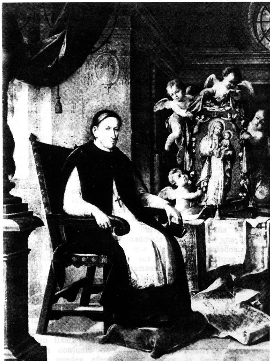
Fig. 1. Retrato de Don Luis de Salcedo y Azcona realizado por el pintor Domingo Martínez, que se conserva en el Palacio Arzobispal de Sevilla.