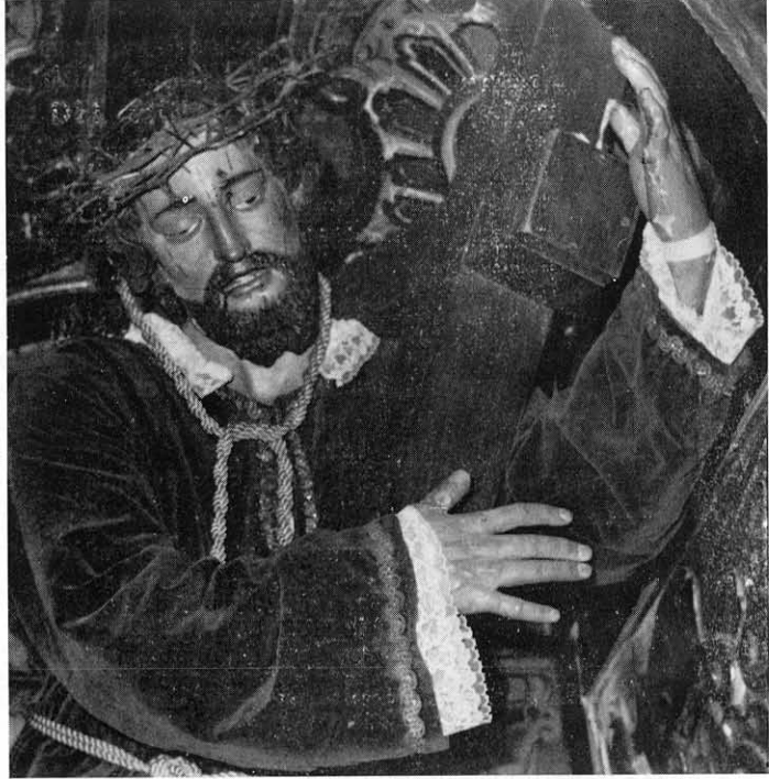
1 y 2. Santuario de Nuestra Señora de la Montaña (Cáceres). Santísimo Cristo de la Salud y Santa Ana, por José Salvador Carmona.—3. Coria (Cáceres). Catedral. San Luis, por José Salvador Carmona.—4. Malpartida de Cáceres (Cáceres). Jesús Nazareno, por José Salvador Carmona.