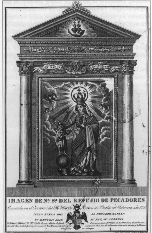
Lám. 5. Imagen de Ntra. Sra. del Refugio de Pecadores

El grabador valenciano Tomás Rocafort y Lopez (23) se vale también del daguerrotipo para dibujar y abrir láminas calcográficas. En la estampa inédita de la biblioteca de la Universidad de Navarra (24) , que lleva por título Imagen de Nuestra Señora del Refugio , venerada en el Oratorio del Barón de Ujola (Lám. 5),