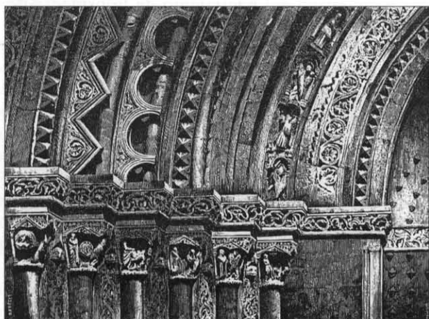
Lám. 1. Detalle de la Puerta del Arzobispo. Catedral de Valencia