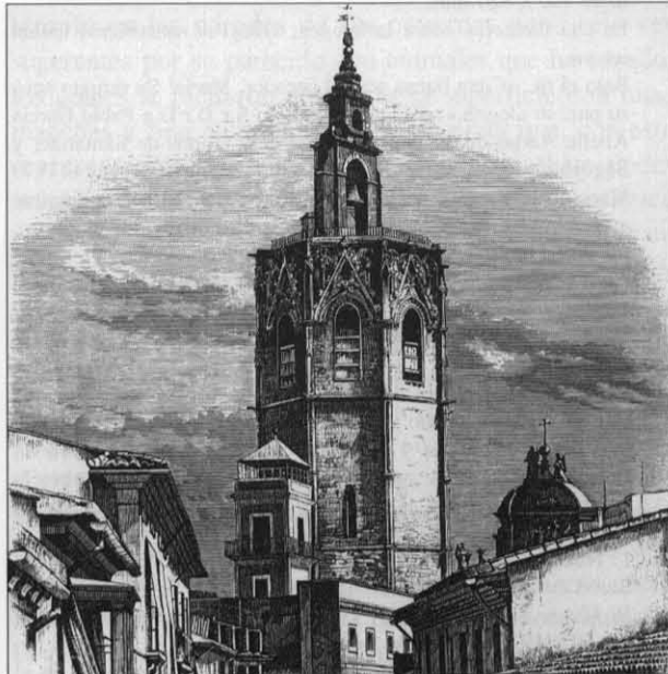
Lám. 4. El Miguelete de Valencia