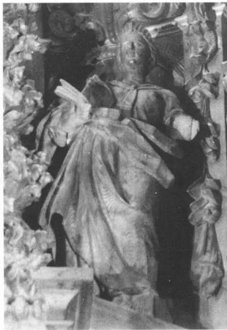
LÁM. I. 1. Retablo mayor de la parroquia de Brozas (Cáceres). 2. Detalle escultórico del fuste. 3. Detalle del grupo escultórico del ático. 4. Escultura de santa mártir romana situada en el lado derecho del ático.