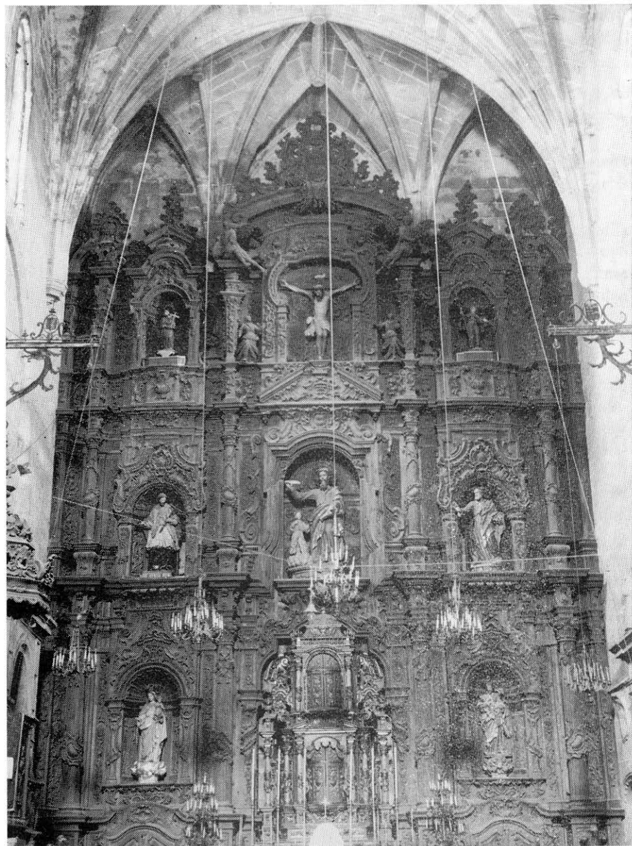
Lámina 2 Retablo mayor de la iglesia de San Mateo en Cáceres.