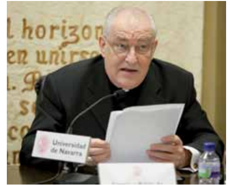
Cardenal Zenon Grocholewski, prefecto de la Congregación para la Educación Católica

den a la enseñanza superior. Este itinerario de estudio tiene como objetivo: promover la formación religiosa de los laicos y personas consagradas; preparar a los candidatos para los diversos ministerios laicales y servicios eclesiales; cualificar a los docentes de religión. La Instrucción tiene la finalidad de uniformar los diferentes Institutos Superiores de Ciencias Religiosas, asegurar un adecuado nivel académico-científico de los mismos, en fidelidad al Magisterio, y responder a los requerimientos, que manifiestan las iglesias particulares, de crear tales Institutos. ■