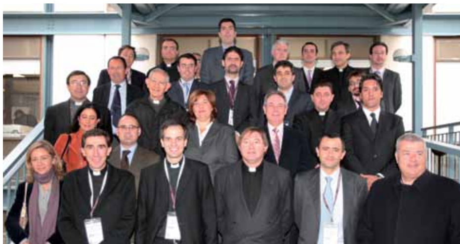
Algunos de los participantes en la Jornada de estudio

Cada Jornada del Grupo de Investigación supone el comienzo del debate interno sobre un tema, en este caso la Asignación Tributaria. Los expertos elaboran propuestas basándose en la discusión y así llegan a conclusiones y aportaciones prácticas. Otras Jornadas tratarán temas como: comunicación institucional en materia económica, inversiones de bienes eclesísticos, aspectos registrales de los bienes de la Iglesia, controles de las enajenaciones, cooperación económica del Estado con la Iglesia, etc. ■