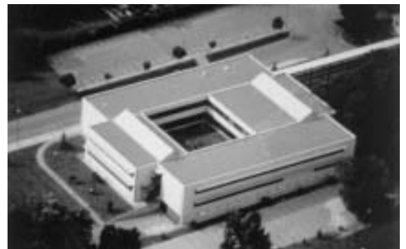
Universidad de Navarra. Edificio Biblioteca de Ciencias.

Que Él mismo dé eficacia de conversión y de madurez cristiana a nuestras tareas.