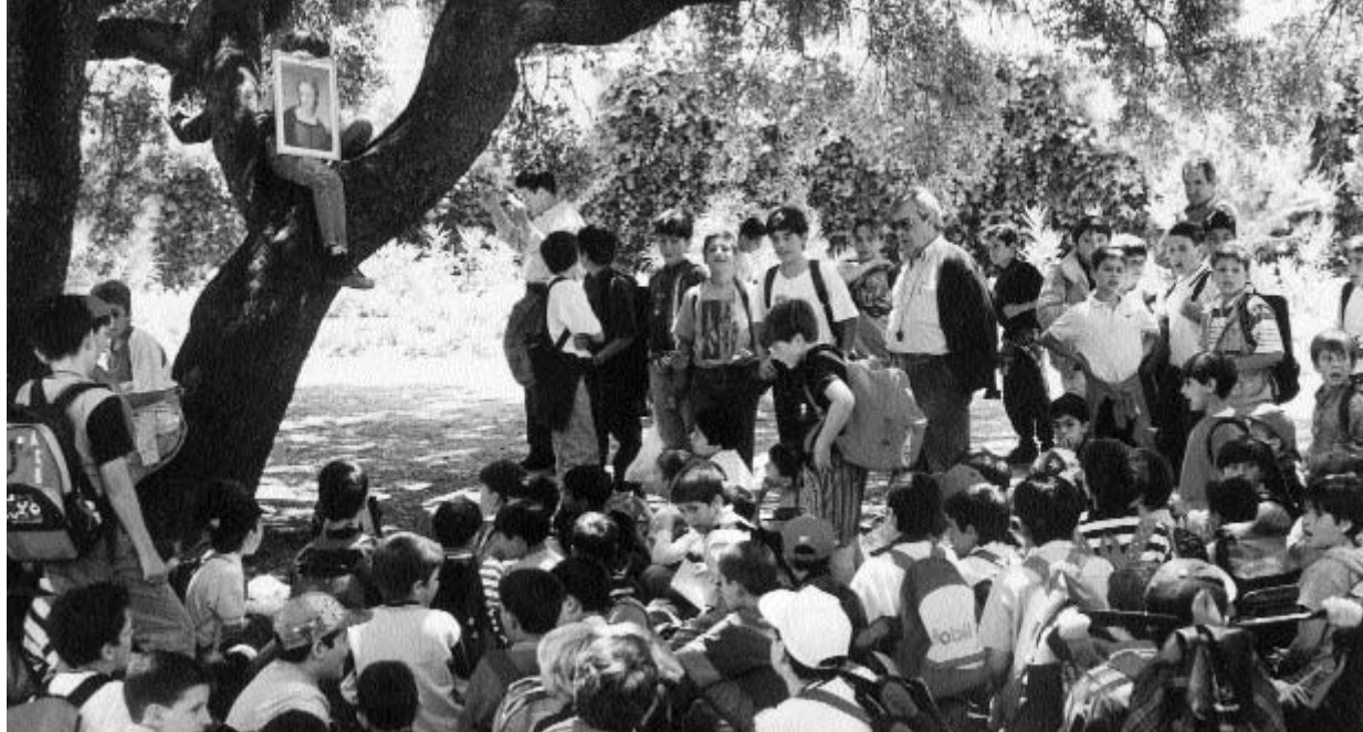
Los más pequeños improvisan una "ermita" para hacer su romería de mayo

empiece el Mes de Mayo, todos se sepan las canciones para cantárselas a la Santísima Virgen.