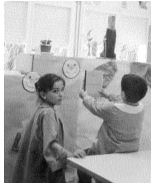
¡Qué bien ha quedado!

En situación de “minoría”, es muy necesario el sentido profesional en el trabajo y un poco de iniciativa para hacerse notar