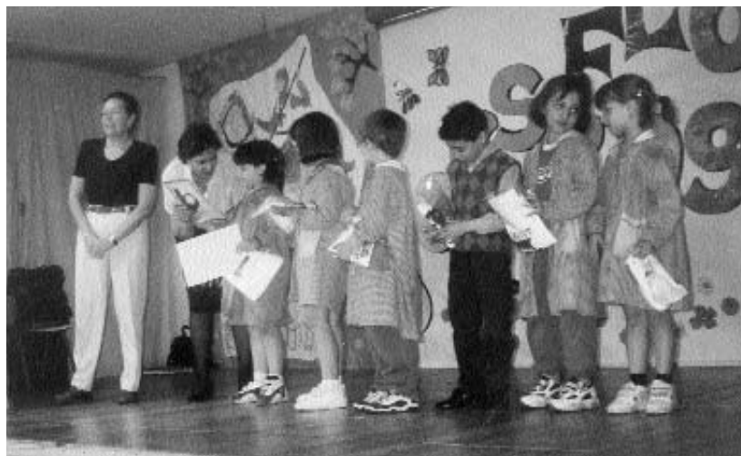
En la Fiesta Navideña: reparto de premios