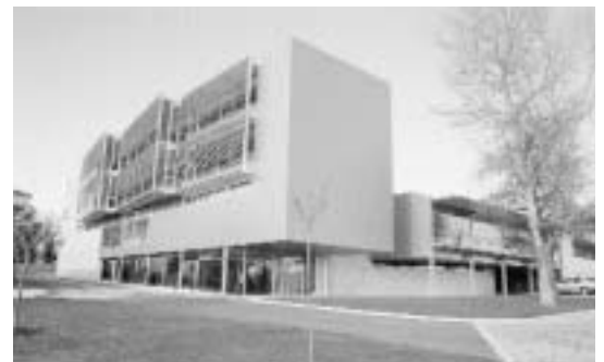
Universidad de Navarra. Edificio de aulas y laboratorios

Si además de respetar el ritmo y la libertad de cada alumno, les ayudamos a escuchar y seguir el ritmo amable y exigente de la gracia de Dios, sea cual sea la edad, estaremos dedicados a la tarea de formar “santos”, que es la palabra con que Pablo de Tarso designaba a los cristianos.