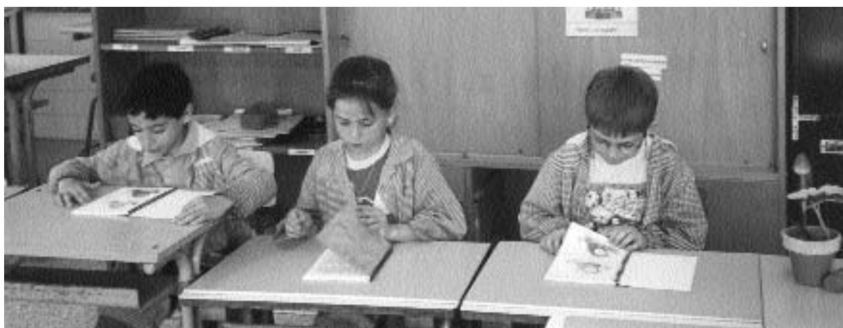
Revisando cómo han quedado sus trabajos

Me parece que sirve de muestra la actividad que pusimos en marcha cuando decidimos celebrar el mes de Mayo de una manera especial: Fueron convoca-