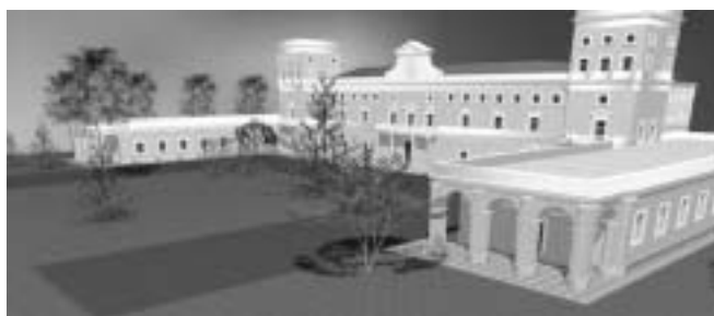
Visita virtual al Campus de la Universidad de Navarra. www.unav.es/un3d/

Todo contenido de fe es ocasión para enseñar a hacer oración. No siempre será fácil; pero vale la pena el esfuerzo. Y cuando se logre un verdadero aprendizaje, aprovechad “Cauces de Intercomunicación” para transmitir a los demás vuestras experiencias de “pedagogía de la oración”.