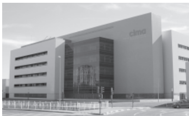
Universidad de Navarra. Edificio CIMA: Centro de Investigación Médica Aplicada