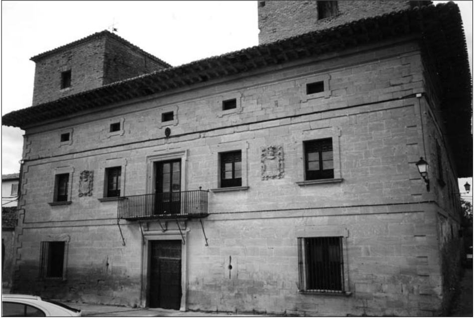
Fig. 18. Muruzábal. Finales siglo XVII.