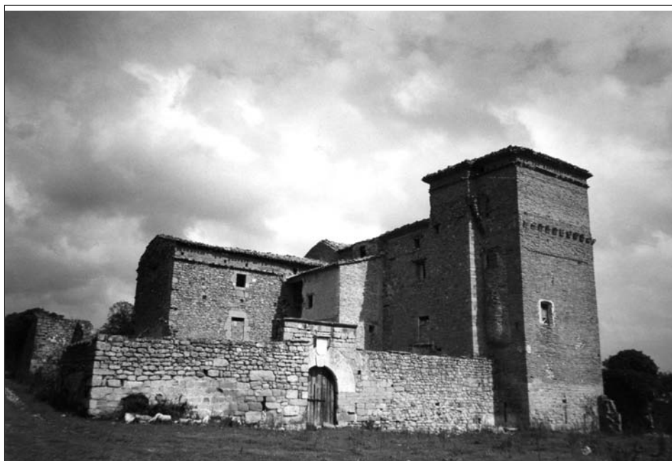
Fig. 12. Igúzquiza. Siglo XVI.