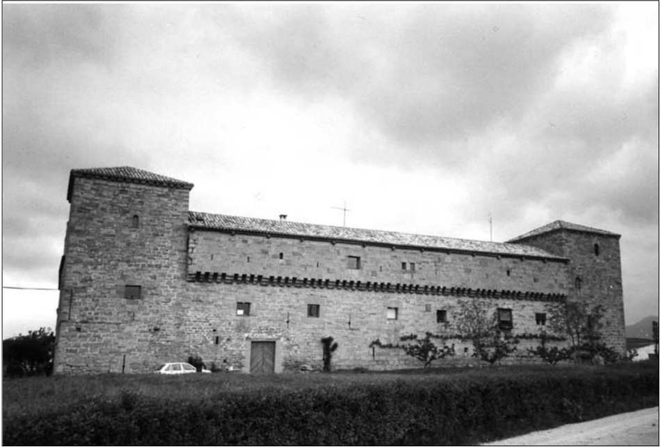
Fig. 10. Arazuri. Siglos XV-XVI.