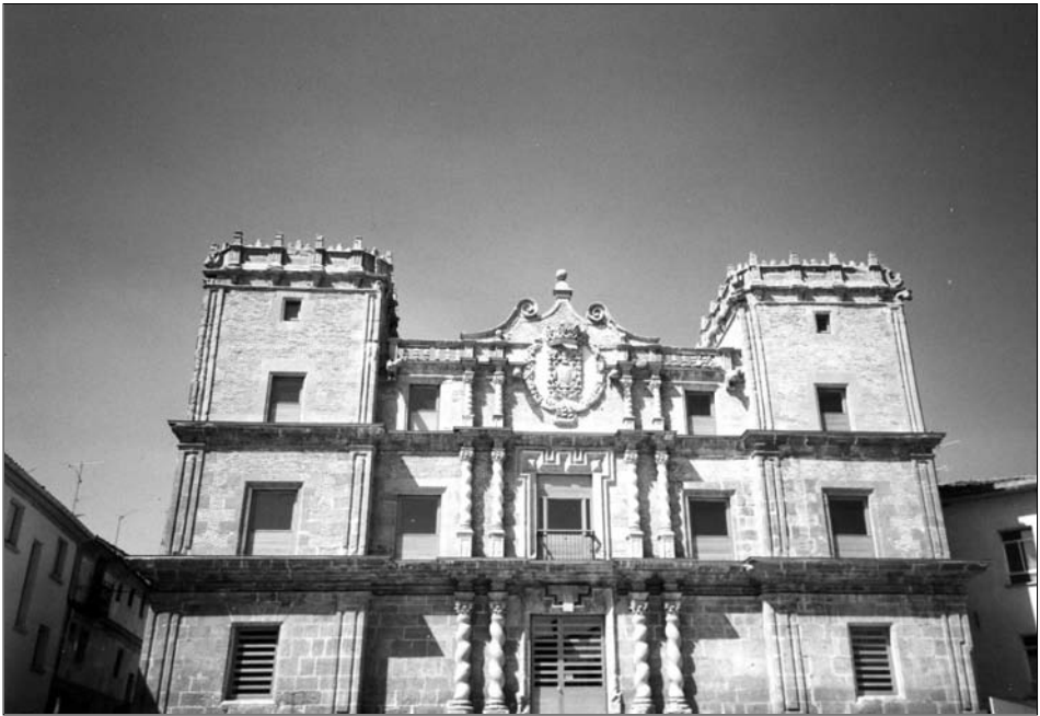
Fig. 19. Miranda de Arga. Finales siglo XVII.