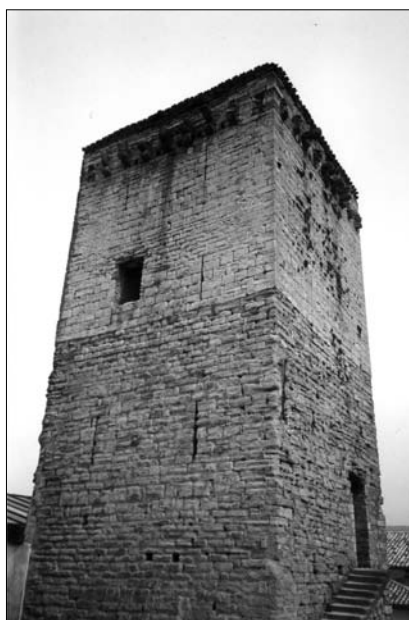
Fig. 1. Yárnoz. Siglo XIV.