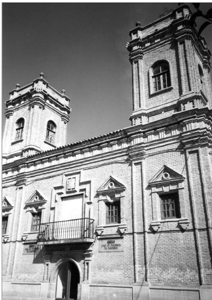
Fig. 20. Valtierra. Finales siglo XVII.