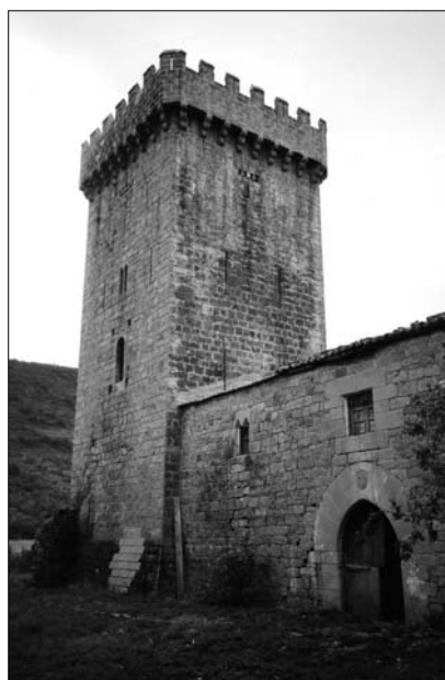
Fig. 2. Ayanz. Siglo XIV.