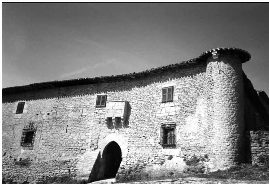
Fig. 9. Echarren de Guirguillano. Siglo XIV-XV.