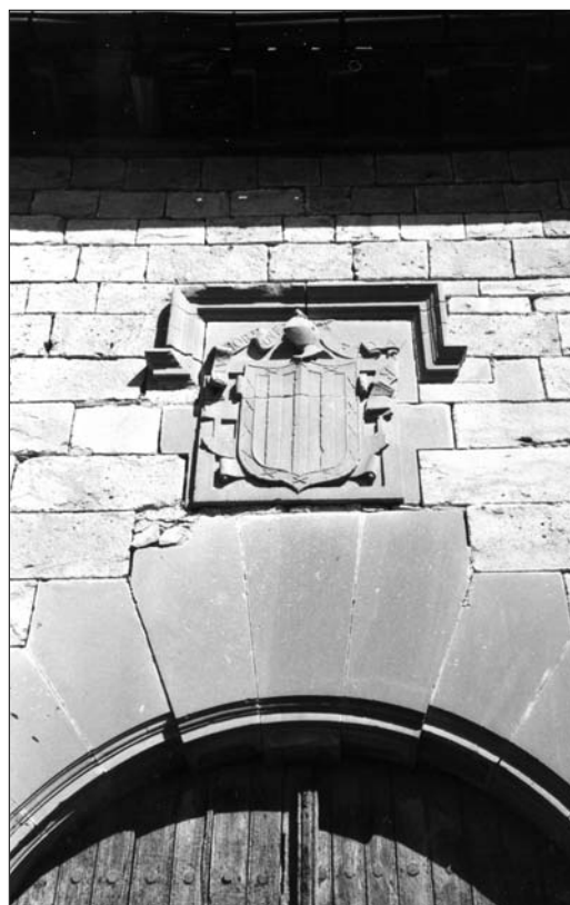
Fig. 13. Olloqui. Siglo XVI.