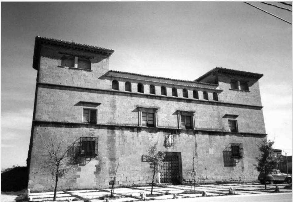
Fig. 15. Barásoain. Siglo XVI.