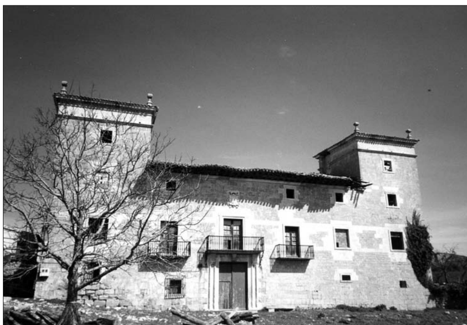
Fig. 17. Viguria. Fachada principal (1630-35).