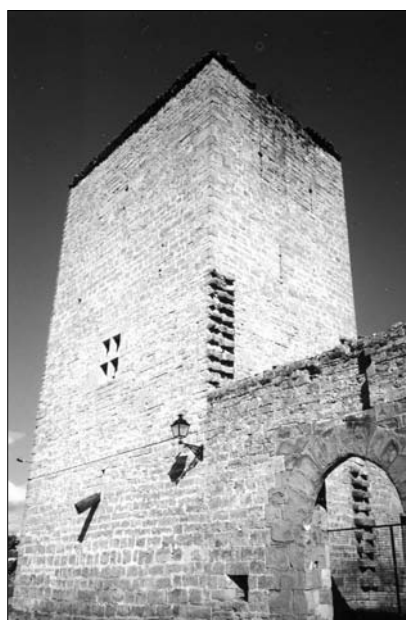
Fig. 4. Artieda. Siglo XIV.