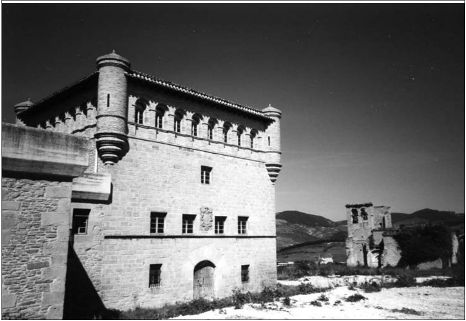
Fig. 14. Gorráiz. Siglo XVI.