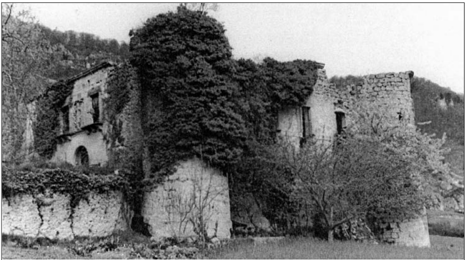
Fig. 11. Eulate. Siglos XV-XVI. Foto Tomás López Sellés (1956). La fachada fue desmontada y trasladada en 1559 al Museo de Navarra.