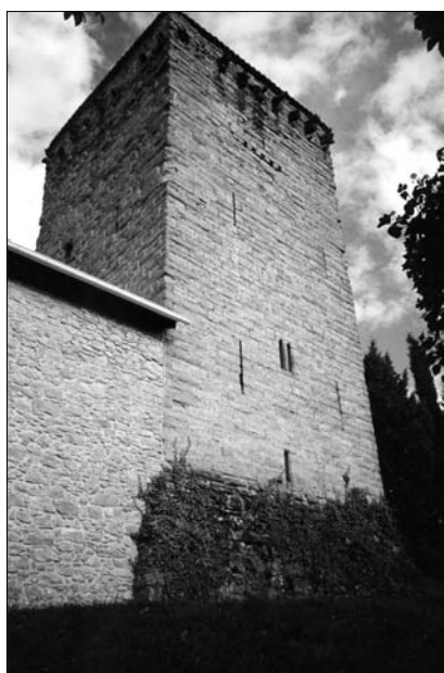
Fig. 3. Echálaz. Siglo XIV.