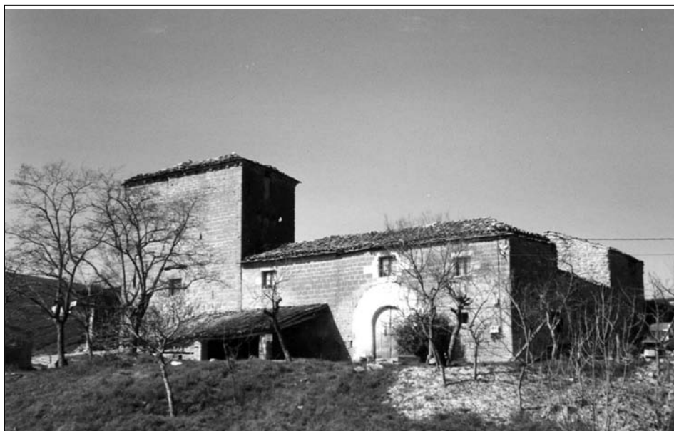
Fig. 8. Larraya. Siglo XVI.