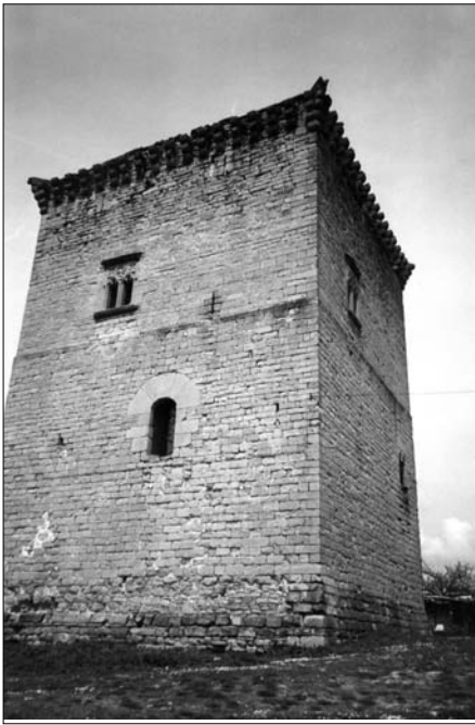
Fig. 5. Olcoz. Siglo XIV-XV.