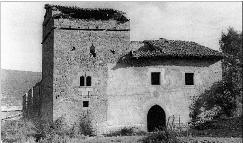
Fig. 7. Ezcay. Siglos XV-XVI.