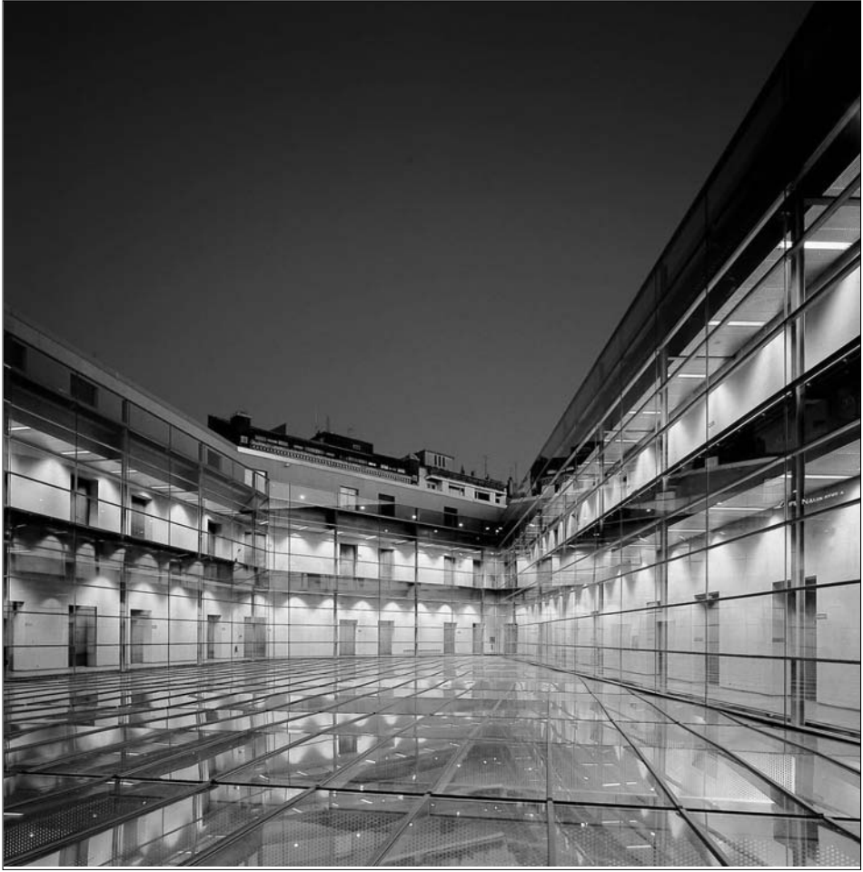
Fig. 6. El patio iluminado