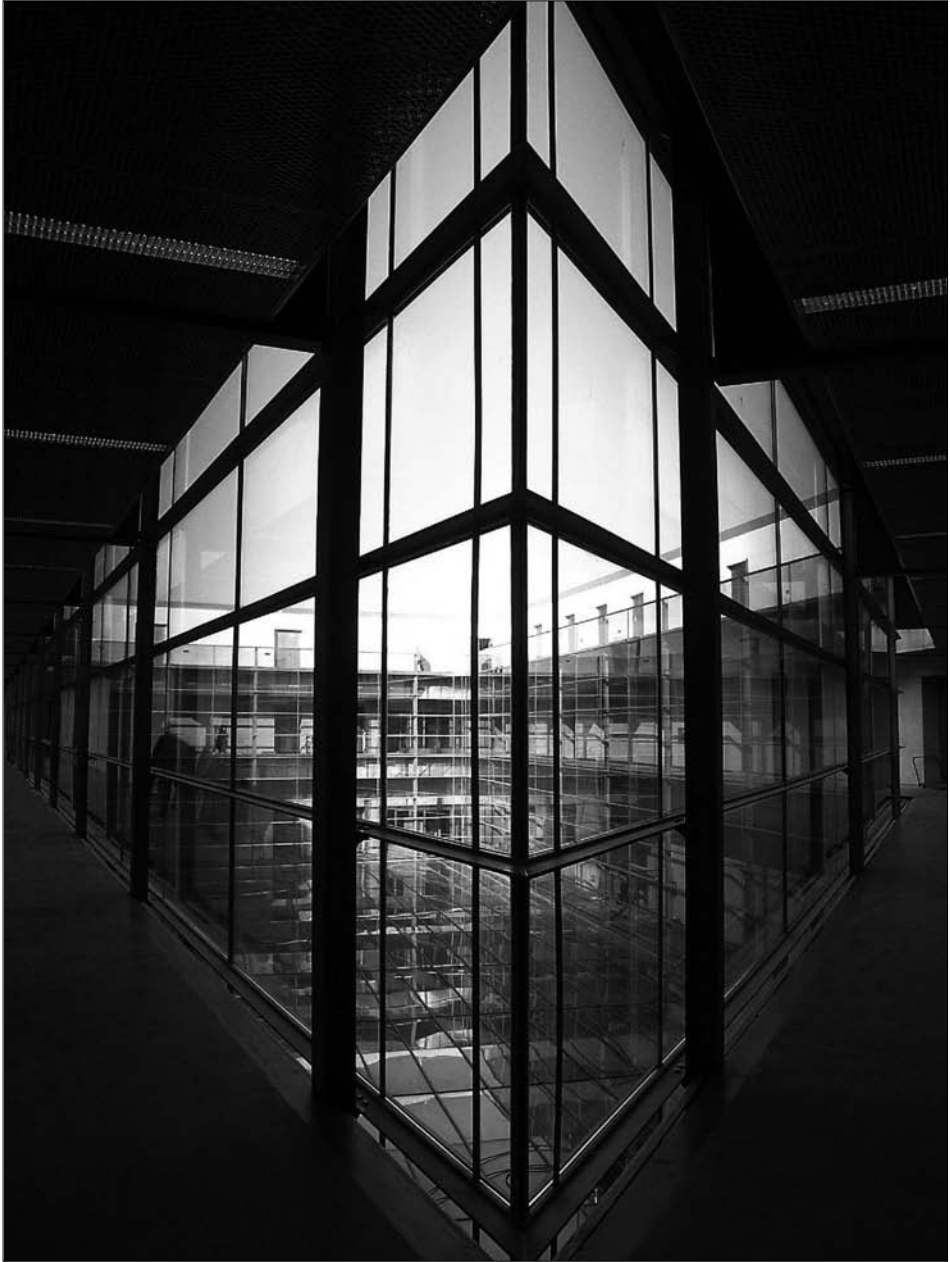
Fig. 8. El pasillo perimetral en la segunda planta