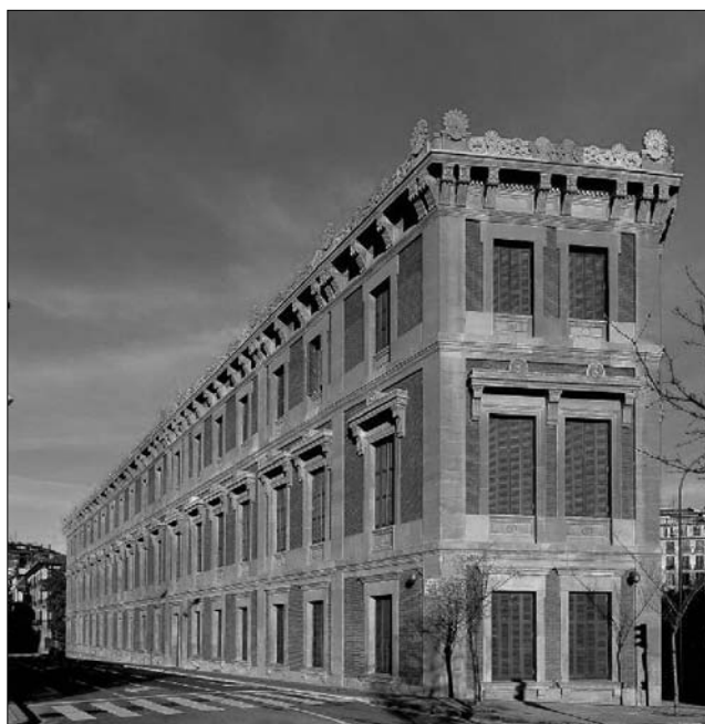
Fig. 9. Fachada a la calle Padre Moret