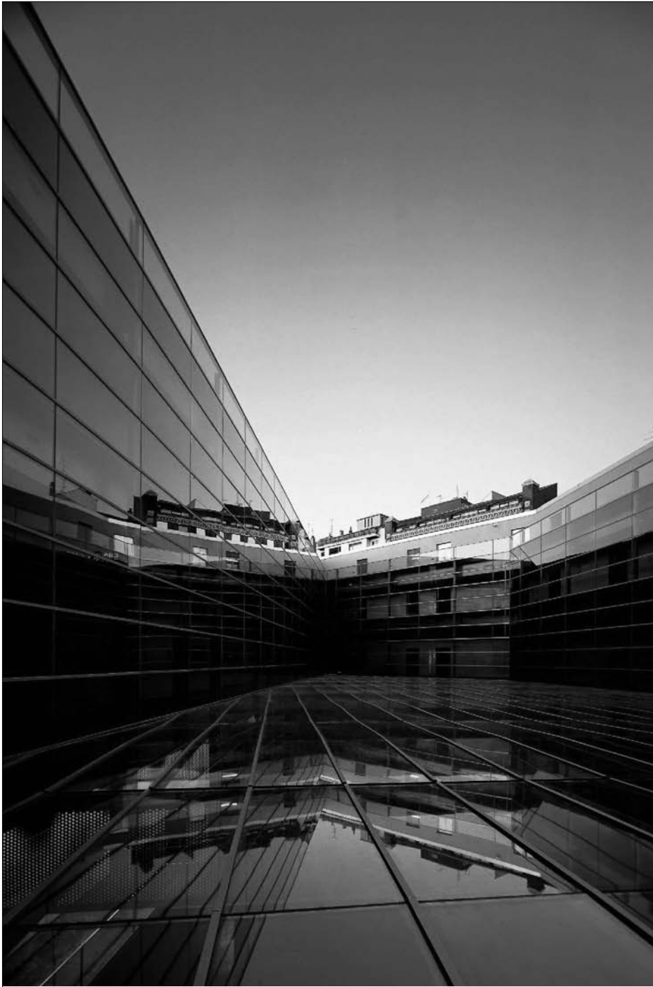
Fig. 7. El patio visto desde la escalera principal