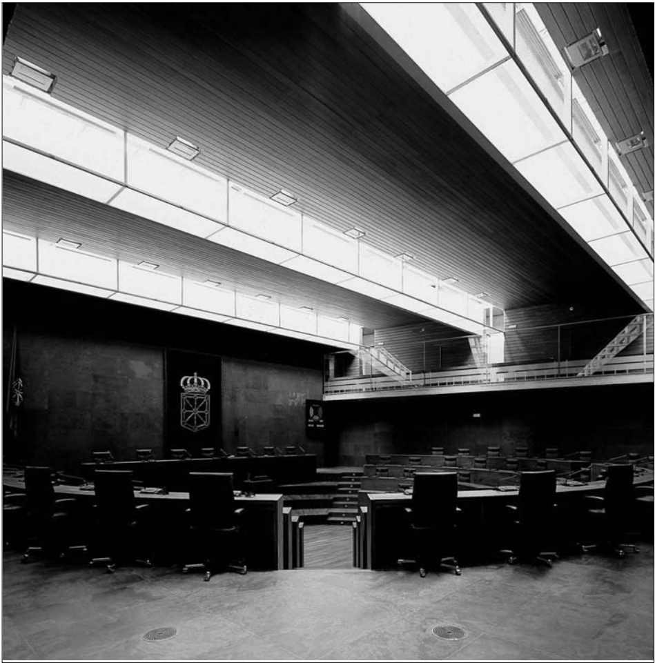
Fig. 10. Salón de Sesiones. Presidencia