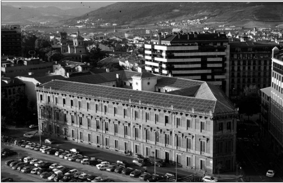
Fig. 1. El edificio de la Audiencia