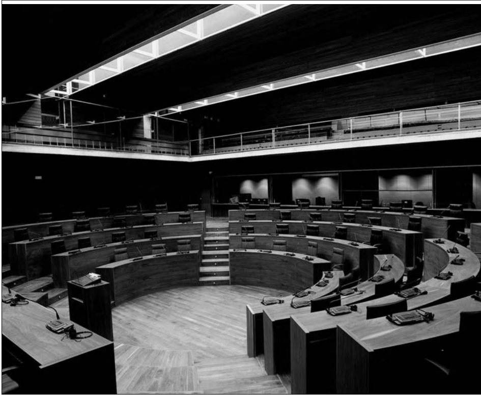
Fig. 11. Salón de Sesiones. Tribunas de público y prensa