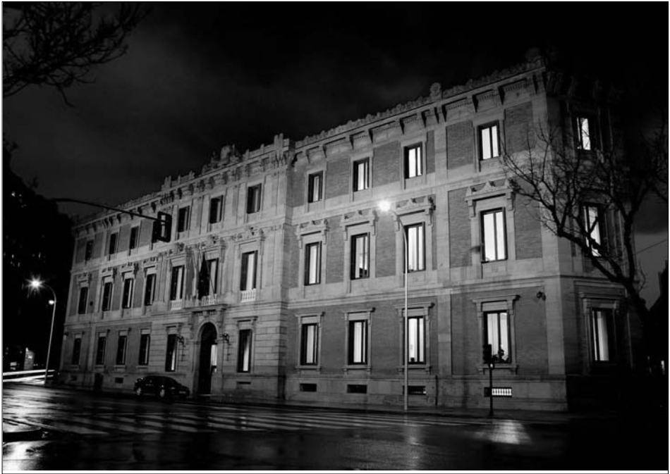
Fig. 3. La fachada principal ya restaurada