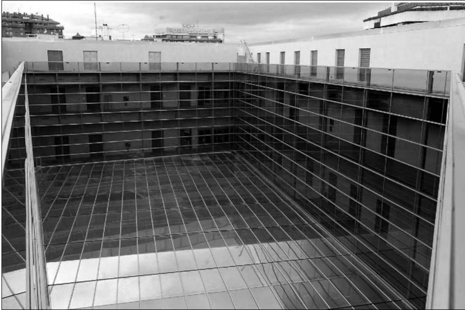
Fig. 5. El vaso de vidrio del patio interior