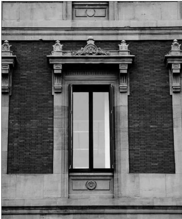
Fig. 4. Detalle de una ventana