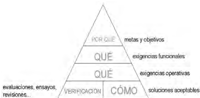
Fig. 1. Estructura de los componentes de la regulación de la edificación del Comité Nórdico de Regulación Edificatoria, NKB

Dinamarca, Finlandia, Islandia, Noruega y Suecia tienen una larga historia de colaboración en el desarrollo legislativo de numerosas áreas, entre las que se encuentra la regulación de la edificación. A finales de los años setenta el NKB (Comité Nórdico de Regulación Edificatoria) estudió la estructura de los componentes de la misma y dibujó una jerarquía de tipo piramidal que, partiendo de metas sociales genéricas y a través de diferentes niveles de detalle, describiera las características de los edificios en términos funcionales y operativos. Adicionalmente, en vez de obligar a una serie de requerimientos para cumplir el código, la jerarquía del NKB permitía el uso de soluciones aceptables, que podían ser prescriptivas o basadas en prestaciones, evaluadas mediante guías específicas de verificación. De acuerdo con ello, la jerarquía del NKB (1976) tenía la siguiente estructura 2 :