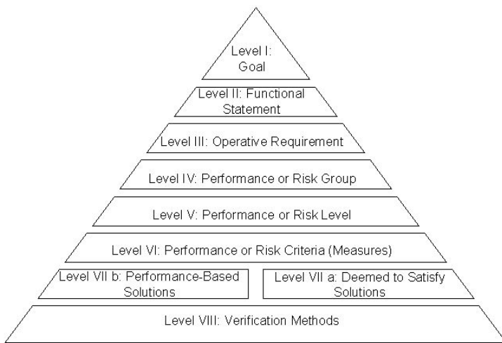
Fig. 2. Jerarquía de ocho niveles del IRCC Performance-Based Building Code (IRCC, 2000)