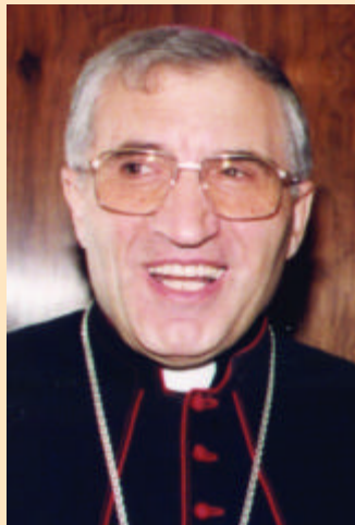
Cardenal Antonio Mª Rouco