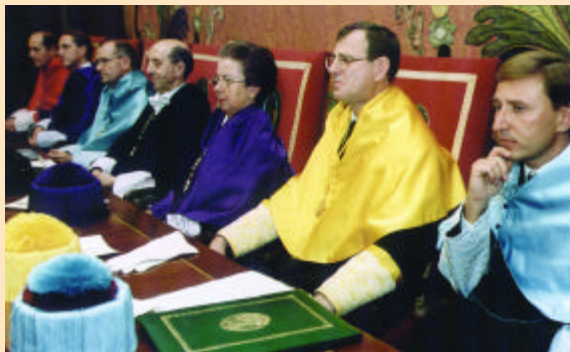
Acto de apertura del curso 2002-2003

En este sentido, recordó: "Bien sabéis que la Universidad carece de capital fundacional, no tiene reservas significativas y las subvenciones que recibe suponen, poco más o menos, un dos por mil de su presupuesto. En consecuencia, su viabilidad requiere que cada curso los ingresos propios no sean superados por los gastos. De esta premisa y del propósito de mantener las tasas académicas y asistenciales en el nivel actual se extrae con facilidad la consecuencia de que la corresponsabilidad económica demanda dos acciones simultáneas: aumentar los ingresos y hacer una buena gestión del gasto".