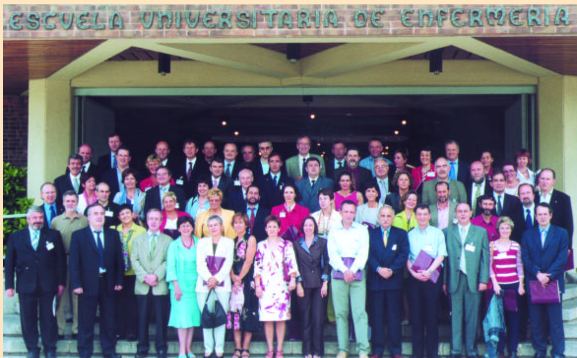
Asistentes al XXV aniversario de la XVII promoción de Medicina

Después de la foto de la promoción, los antiguos alumnos visitaron las Bodegas de Otazu, donde se celebró la comida que se prolongó hasta altas horas de la tarde.