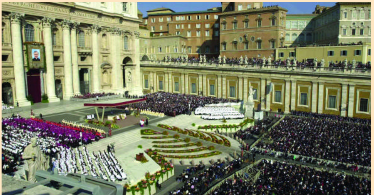
Ceremonia de canonización

A la izquierda del altar papal se situaron las autoridades eclesiásticas, más de 400 entre cardenales, arzobispos y obispos. Muchos de ellos acudieron a Roma acompañando a los peregrinos de sus propios países. Cabe destacar la presencia de 50 obispos africanos, 53 españoles y 55 italianos. Además, 1.040 sacerdotes distribuyeron la comunión en la plaza San Pedro, en la plaza Pío XII y en la Via della Conciliazione.