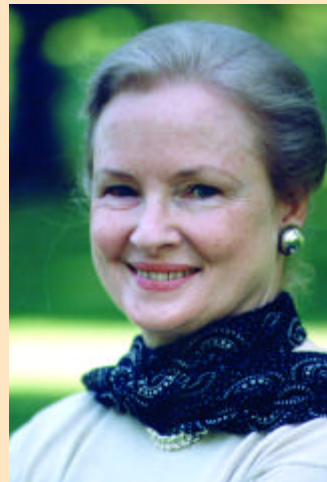
Mary Ann Glendon