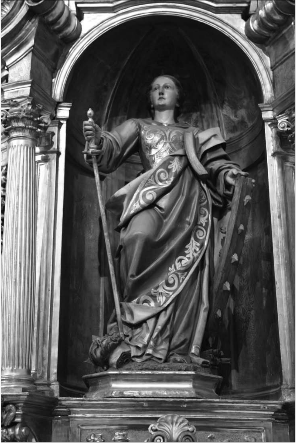
Fig. 5 Lekaroz. Parroquia de San Bartolomé. Retablo de Santa Catalina.