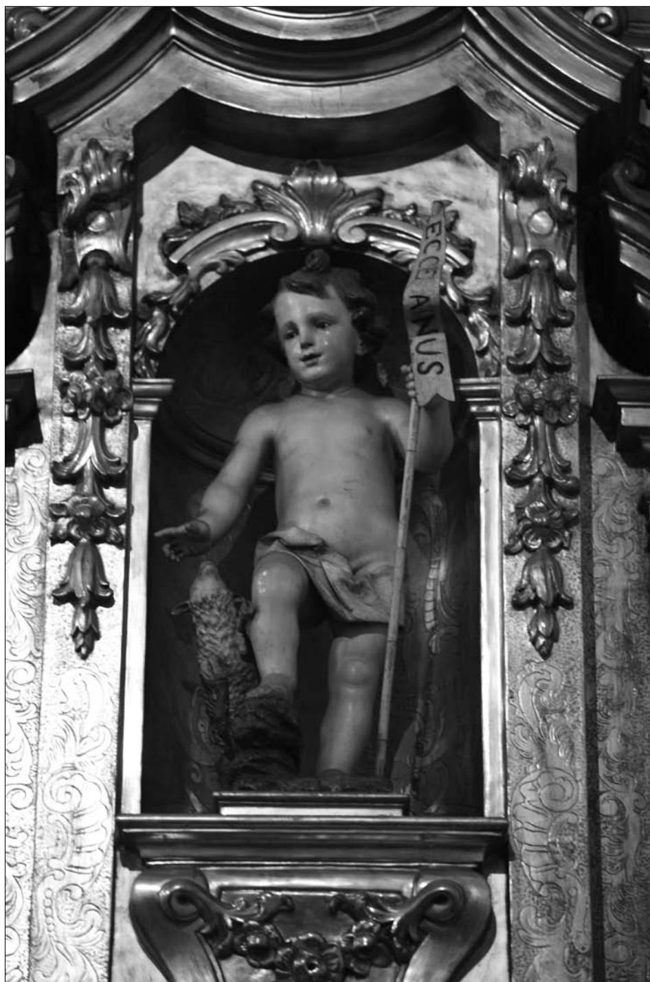
Fig. 8 Lekaroz. Parroquia de San Bartolomé. Retablo de Santa Catalina. San Juan Bautista.