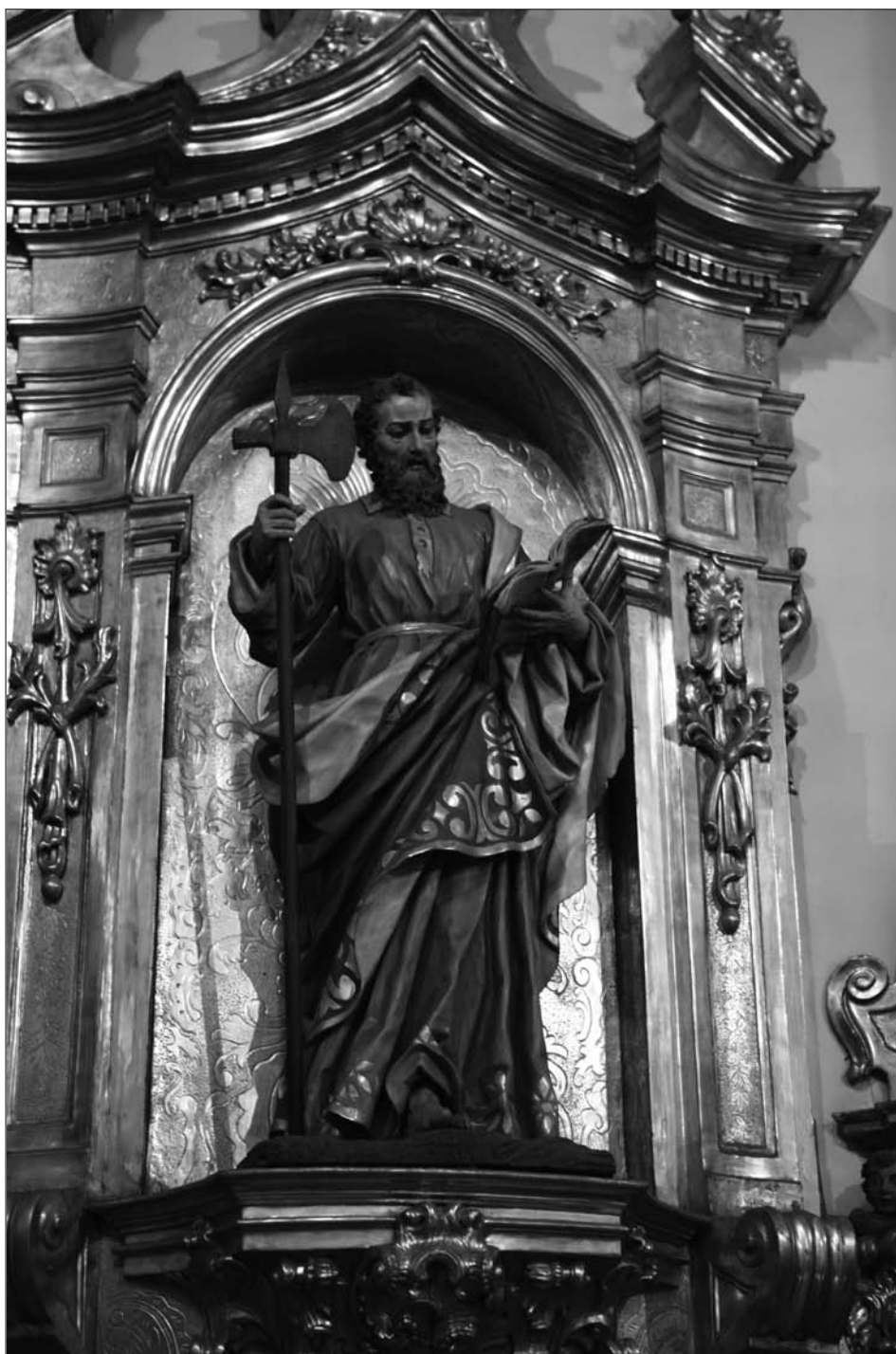
Fig. 3 Lekaroz. Parroquia de San Bartolomé. Retablo mayor. San Matías.