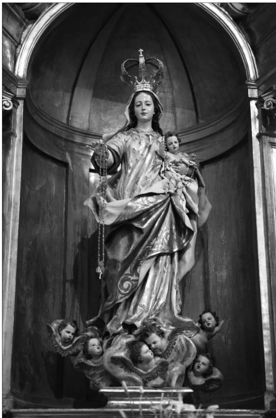
Fig. 6 Lekaroz. Parroquia de San Bartolomé. Retablo de la Virgen del Rosario.