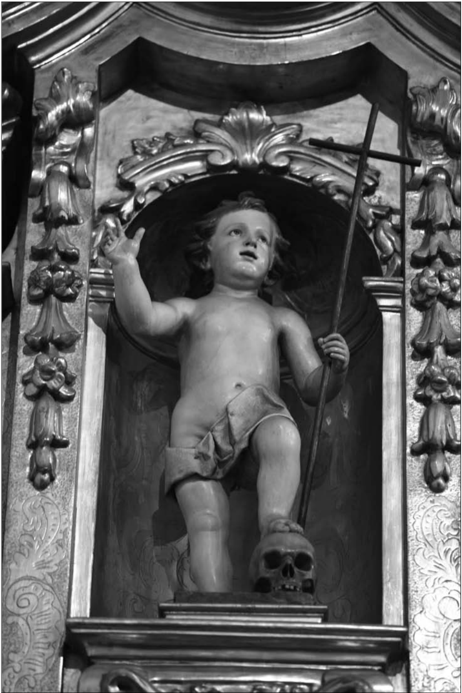
Fig. 7 Lekaroz. Parroquia de San Bartolomé. Retablo de la Virgen del Rosario. Niño Redentor.