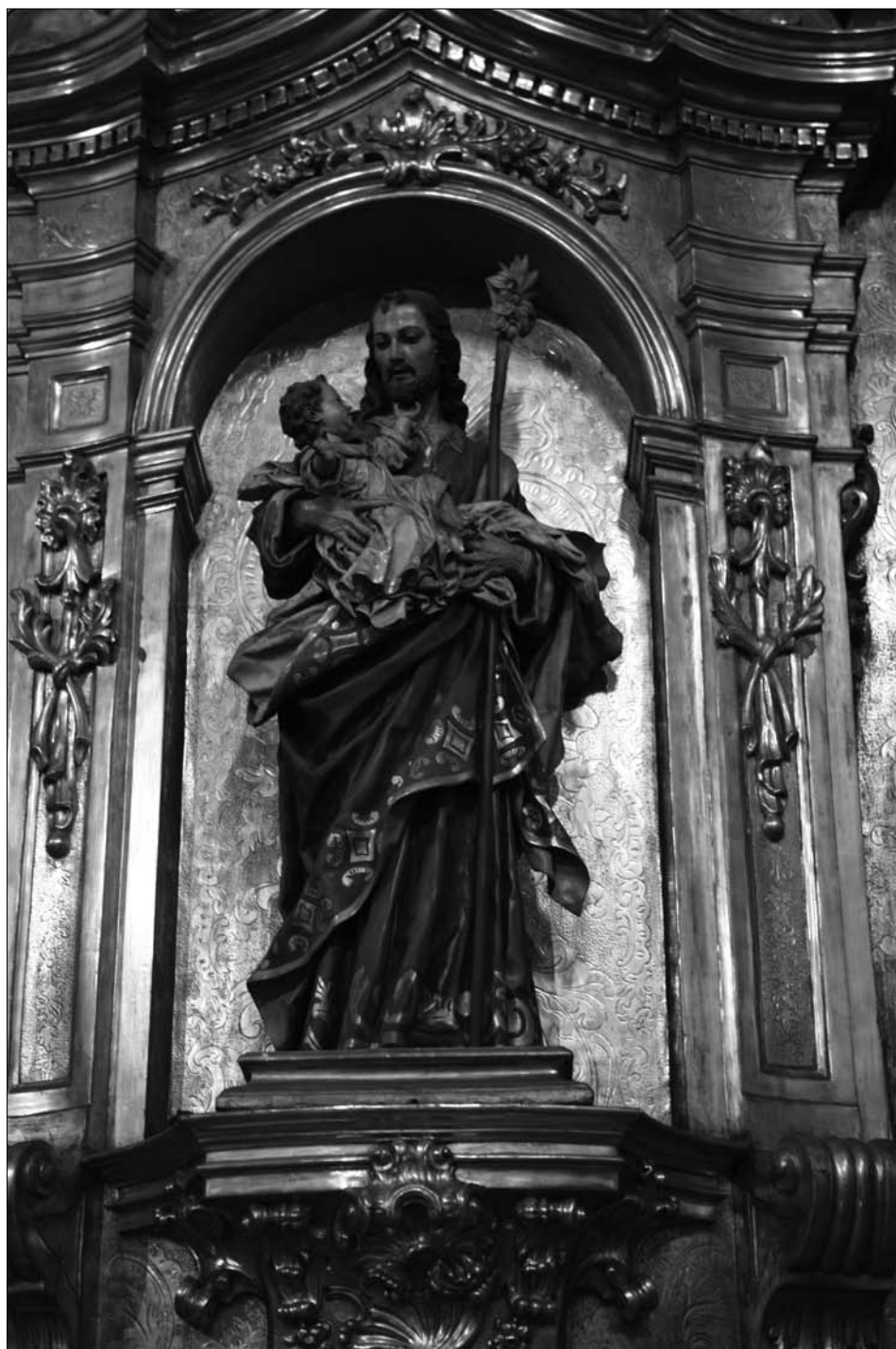
Fig. 4 Lekaroz. Parroquia de San Bartolomé. Retablo mayor. San José con el Niño.