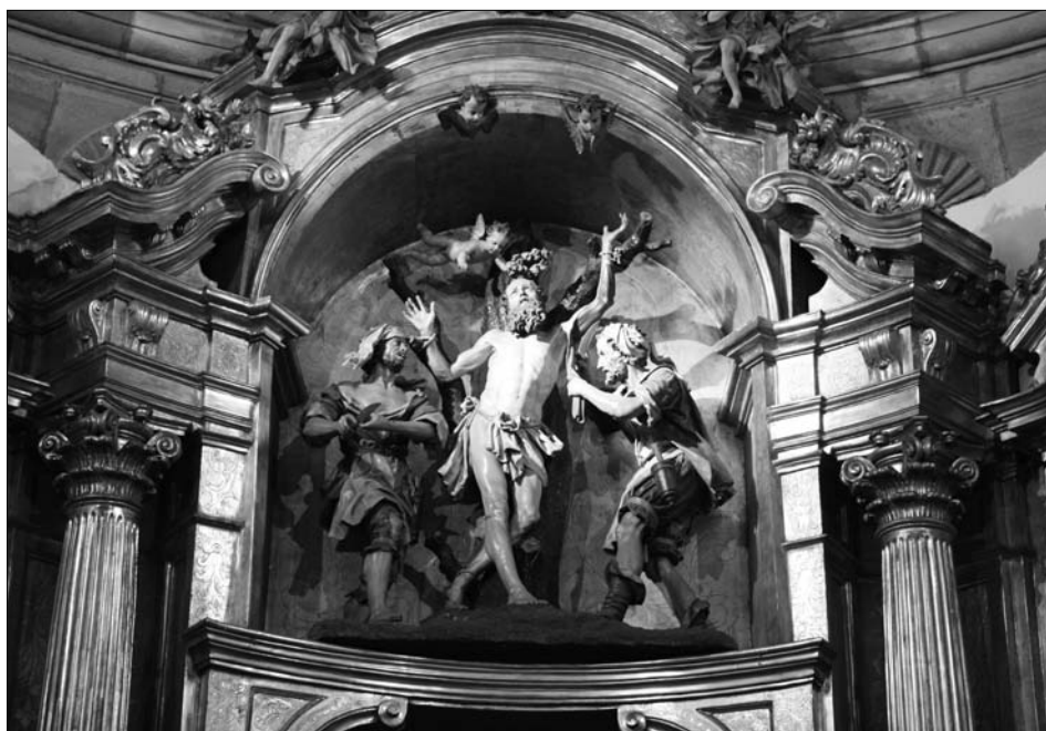
Fig. 1. Lekaroz. Parroquia de San Bartolomé. Retablo mayor. Martirio de San Bartolomé.