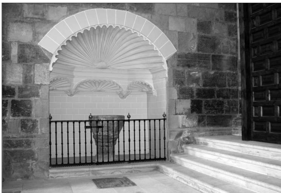
Fig. 3. Baptisterio frente a Capilla de los Mezquita (San Martín).