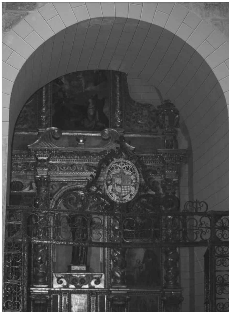
Fig. 4. Capilla de los Egües (Dolorosa).