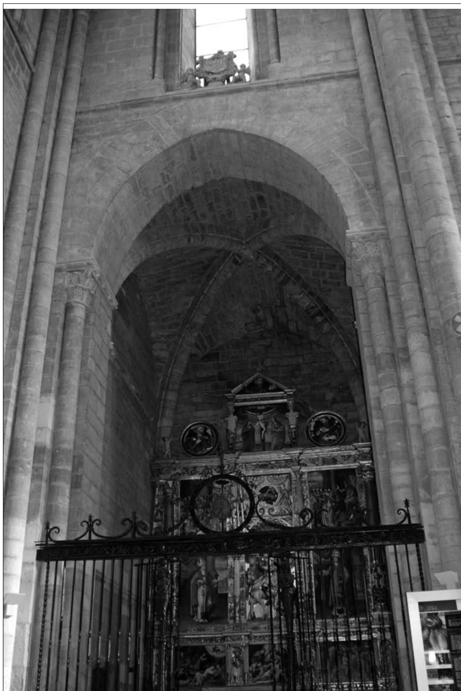
Fig. 2. Capilla de los Mezquita (San Martín).