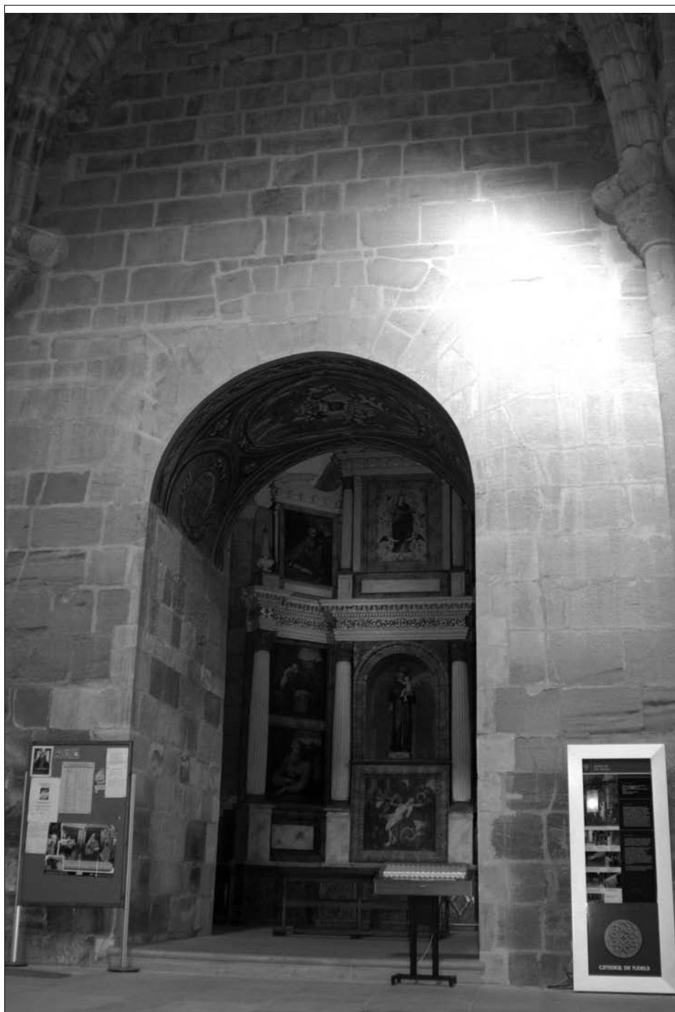
Fig. 8. Capilla bajo Torre Nueva (antigua Capilla Santa Ana).