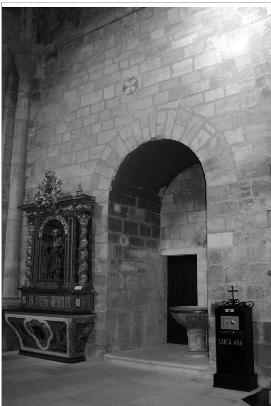
Fig. 7. Baptisterio. Sacristía de los Capellanes, segunda de las tres partes que conforman la Capilla de Santa.