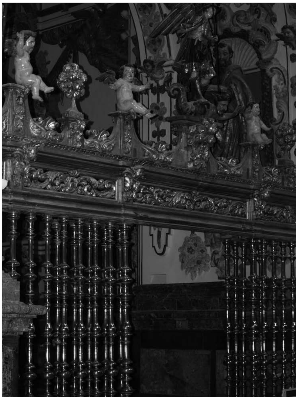
Fig. 6. Capilla de San Miguel, una de las tres partes que conforman la Capilla de Santa Ana.