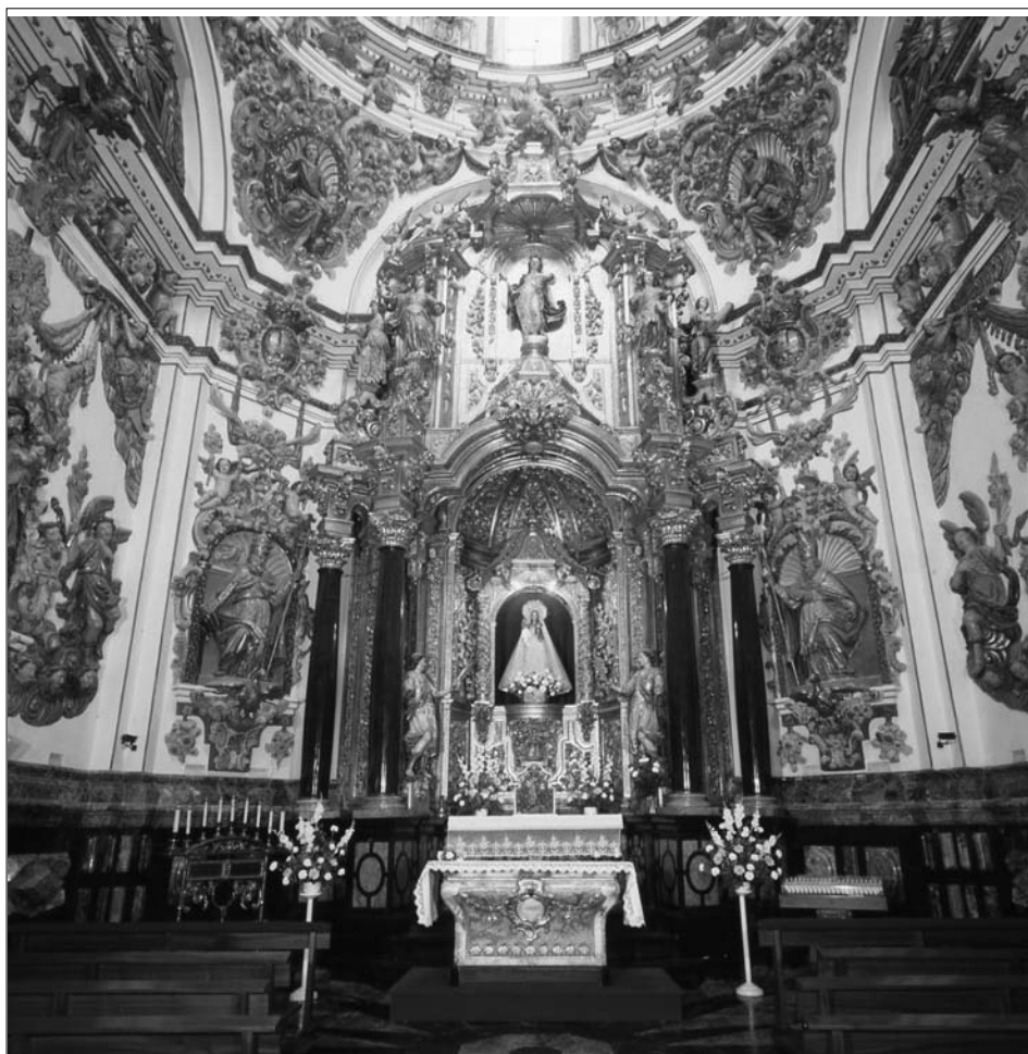
Fig. 5. Capilla de Santa Ana.