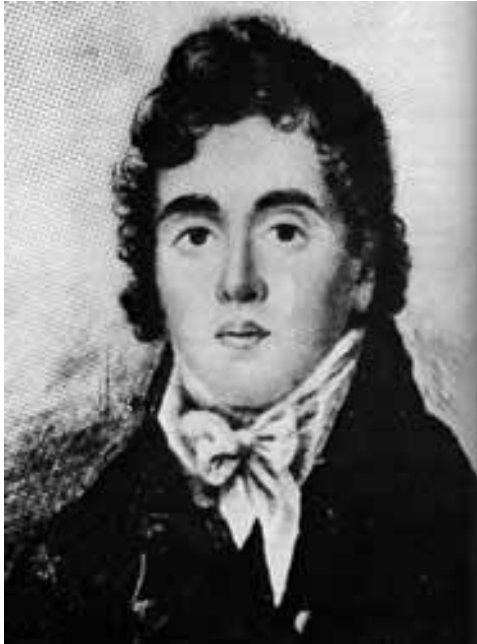
Fig. 3. Retrato de Beau Brummell en 1815.

2. Cfr. NEUMEYER, F., Mies van der Rohe. La palabra sin arte. Reflexiones sobre arquitectura 1922-1968 . El Croquis Editorial, Madrid 1995, p. 228. “El dandy puro -que es estético- hace de su vida su creación de arte. El dandy -Wilde-, que además es artista, hace de su vida un arte, y de su arte, propiamente dicho, la expresión más exquisita, más perfecta de esa vida, arte ya ella misma”. DE VILLENA, L. A., Corsarios de guante amarillo , Tusquets, Barcelona 1983, p. 98.