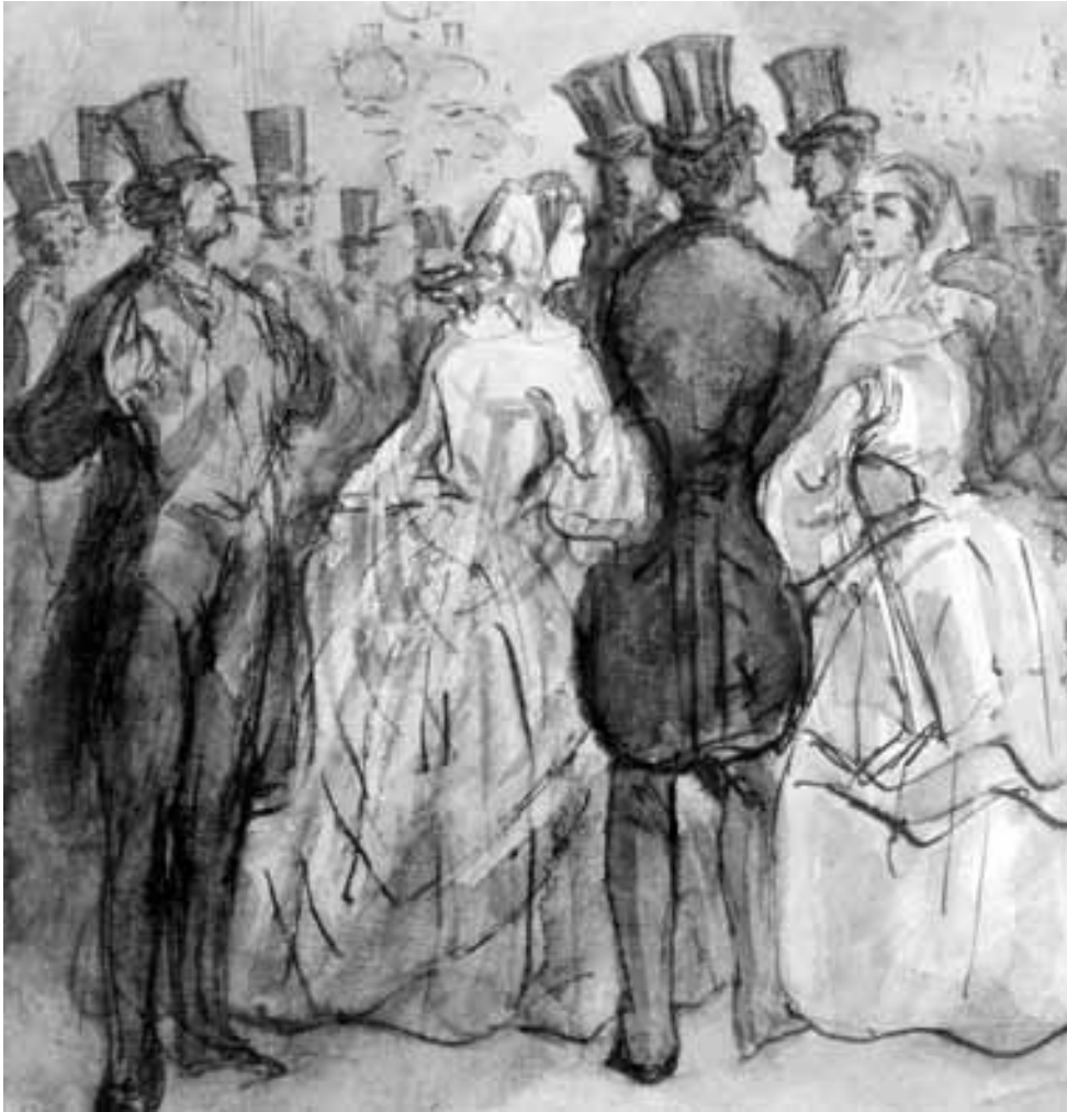
Fig. 6. Dibujo de Constantin Guys.

Y la ciudad es el territorio en el que el Sr. C. G. realiza “su pasión y su profesión (que) es desposar la multitud”; es el perfecto flâneur , que recorre incesantemente la ciudad observándola de incógnito: “Así el enamorado de la vida universal entra en la multitud como en un inmenso depósito de electricidad. (...) Es un yo, incansable del no-yo, que, a cada instante, lo refleja y lo expresa en imágenes más vivas que la vida misma, siempre inestable y fugitiva” 26 . Pero no es un simple flâneur , no se dedica meramente a viajar por ese “gran desierto de hombres” que es la multitud, sino que va en busca de “ese algo que se nos permitirá llamar la modernidad” 27 .