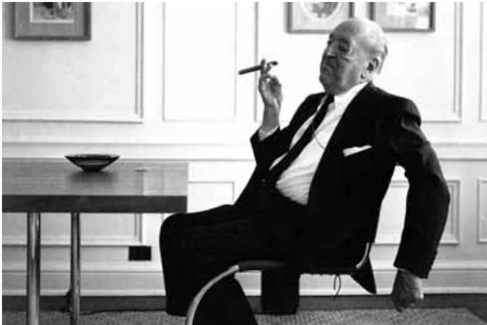
Fig. 4. Mies van der Rohe en su apartamento de Chicago.

te con la incorporación al ideal del dandismo de figuras como Barbey d'Aureville 10 , Oscar Wilde y, sobre todo, Charles Baudelaire cuando el mito del dandi toma cuerpo como opción intelectual, síntoma del cambio social e histórico que vive Europa a lo largo del siglo XIX mientras se gesta la modernidad 11 .