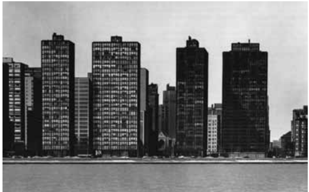
Fig. 12. Mies van der Rohe. 860-880 Lake Shore Drive y 900 Esplanade. Chicago.

42. BAUDELAIRE, C., op. cit., p. 116. Daniel Aragó explica en las notas al texto que la orden del Viejo de la Montaña fue una secta dada a conocer por Marco Polo y que gozó de una fortuna considerable en la época romántica. Por otra parte, la expresión ¡Perinde ac cadaver! (como un cadáver) está tomada de San Ignacio de Loyola, de las Constituciones de la Compañía de Jesús y su sentido es la prescripción a los miembros de la Orden de disciplina y obediencia a sus superiores. Es utilizada habitualmente como referencia a la obediencia ciega. Cfr. Ibidem , pp.157-58.