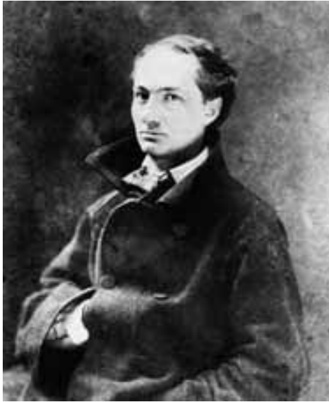
Fig. 5. Charles Baudelaire fotografiado por Felix Nadar en 1855.

Aunque, por encima del aspecto formal de la omnipresencia del cigarro, lo que realmente protegía la intimidad del arquitecto alemán era un carácter perfilado por una serie de rasgos psicológicos para cuya ilustración han sido utilizados términos como gravedad, impasibilidad, ironía o misterio, incluso pasividad, que también se han acuñado para describir la psicología del dandi 16 . La relación desarrollada con las distintas mujeres que atravesaron su vida tampoco dista mucho de la conducta habitualmente practicada por los dandis para con el sexo femenino. Los distintos pasajes de su biografía que guardan relación con esta cuestión ilustran una permanente afirmación vital de independencia y de ausencia de compromiso que se manifestaría en el abandono de su familia cuando en los años veinte decidió reinventarse como arquitecto de vanguardia y que se revelaría de nuevo en su relación con Lili Reich 17 , apartada como lastre ante su definitivo traslado a América. Un comportamiento que le condujo indefectiblemente hacia la soledad, que es el inevitable final del dandi 18 .