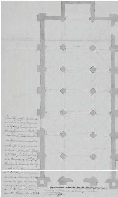
Figura 7. Santa María Incháurregui, A. (1793) Plano sobre la remodelación que necesitaría el templo franciscano para abovedarlo. CEHM.

El segundo: que dicho vecindario promete con igual voluntad y gusto son todos los alcos o pilones de las tiendas...consignados a esta Fabrica: con cuio importe les consta experimentalmente que en gran parte se contribuirá a la paga de los Jornaleros de la obra: pues con solo este arbitrio que otra vez tomaron de comun consentimiento se costeo el mismo actual Techo que tiene de madera y texa. A que ultimamente se agrega la pequeña contribusion de quinientos pesos que tiene prontos mi Yglesia para dar principio simple que sea del superior agrado. Esto es lo que con verdad y como Ministro de Dios pudo informar en descargo de mi obligación. Zacatlan y octubre de 1788. Firma Jose Antonio Valtierra 6 .