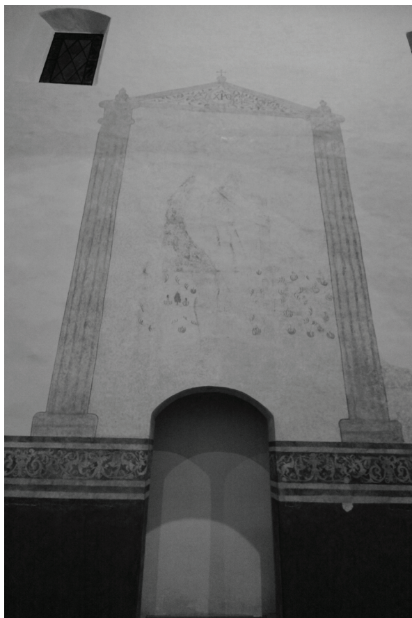
Figura 5. Parra Aldave, J.A. (2014) Fotografía de la Pintura Mural en el muro sur de la nave lateral en lo que fuera el acceso al claustro.

Todas estas pinturas permanecieron ocultas durante muchos años, gracias a los diversos cambios de época, los cuales trajeron consigo necesidades distintas a las que dieron origen a aquella pintura, cubriéndose más adelante con diversos retablos dorados propios del barroco, como respuesta a las distintas cofradías que se congregaron en este templo franciscano, tal como lo vemos referido en el legajo que presentamos con anterioridad. Afortunadamente la pintura mural pervivió durante mucho tiempo gracias a que se decidió ocultarla bajo distintas capas de pintura a la cal. También se localizó pintura en lo que fue el acceso del templo al claustro conventual, en el que se muestra una figura de grandes dimensiones, que probablemente por su forma y ubicación fuese