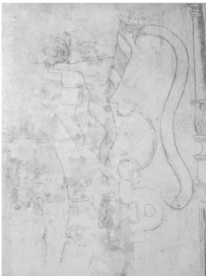
Figura 4. Rivera Scott, N. (2009) Fotografía de la Pintura Mural en el muro norte de la nave lateral cercana al Presbiterio.

Otra de las figuras que llama la atención es la localizada en el muro norte cercano al presbiterio; se trata de una figura masculina desnuda, con corona, portando una especie de trompeta, en posición de estar montando, y a un lado una columna clásica. Lo que nos habla de la presencia de elementos renacentistas, cuya alusión pudiese estar ligada a simbolismos cristianos como el triunfo de la Iglesia, o bien la entrada de Cristo Rey en Jerusalén, muy a la manera de aquellos tiempos, tal como en la portada encontramos el sello típico del manierismo (Figura 4).