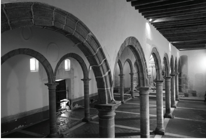
Figura 6. Parra Aldave, J. A. (2014) Fotografía de la Pintura Mural en la Porciúncula.

San Cristóbal (Figura 5) y en la puerta norte o porciúncula se encontró lo que pareciese una alegoría de la vida de San Francisco (Figura 6), un poco al estilo de la pintura que se localiza en el muro de la epístola en el templo conventual franciscano de Tepeaca.