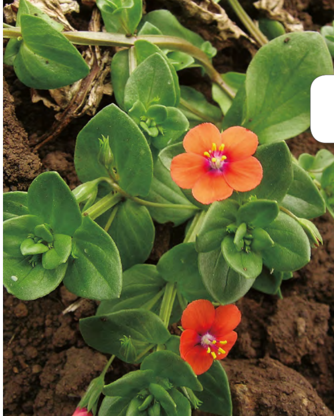
Arnoldo Álvarez Escobar