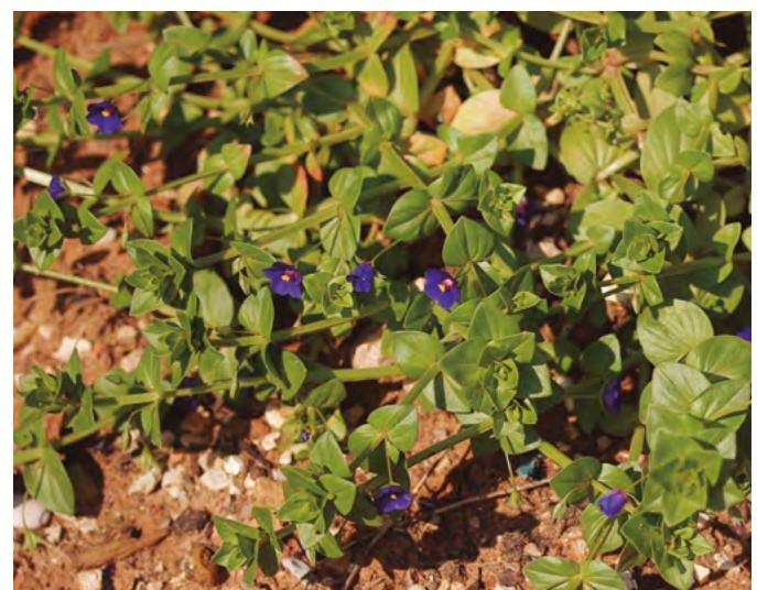
Anagallis arvensis. Emilio Lojuna

Hay testimonios del uso de esta planta para el herpes en Córdoba, Cantabria, Guipúzcoa y Navarra [11,16,21,29]. En Navarra se empleaba la parte aérea florida cocida en cataplasma [21] y en Guipúzcoa se frotaba la parte afectada con la planta fresca [29].