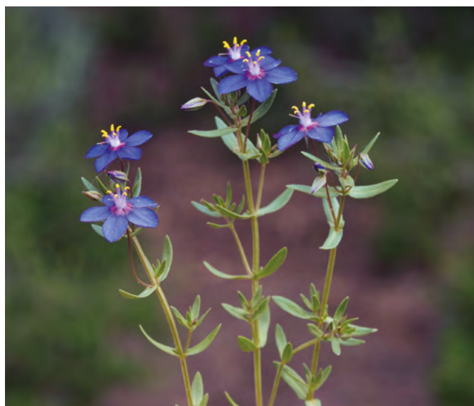
Anagallis monelli. Javier Tardío