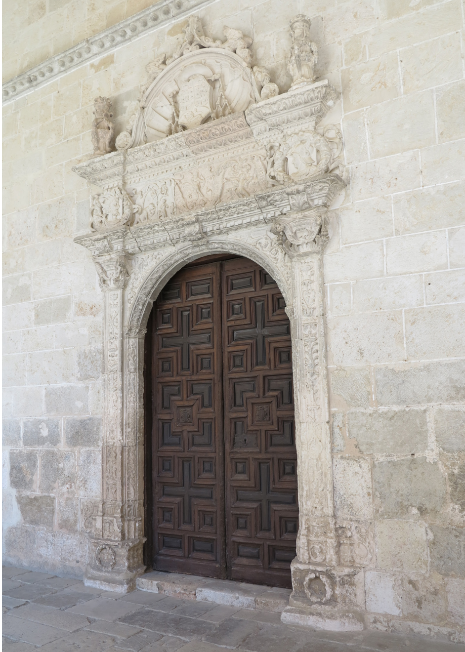
Figura 3. Portada a la antigua librería levantada por el obispo Alonso Enríquez (c. 1525).