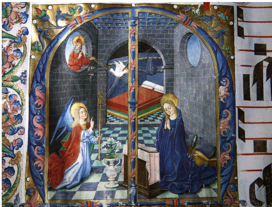
Figura 8. Detalle del cantoral n.º 5, Maestro de Osma (s. xv), desde la Purificación de la Virgen hasta la Anunciación, f. 114v..

periodo trabajan en la edición de misales y cantorales Cristóbal Rodríguez 116 , y en las correcciones Pedro Colomo y el infante Pedro Palomar 117 .