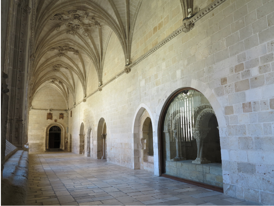
Figura 1. Panda este con la arcada de la antigua sala capitular, acceso primitivo al piso superior, la capilla de los Treintanarios, puerta de la biblioteca, salida a la calle del Pozo, capilla de la Virgen de las Angustias y Capilla de la Concepción.

de sacristía mayor, capilla de las reliquias y sitio para la custodia de las alhajas de plata y joyas 5 .