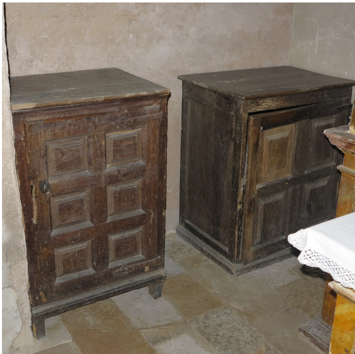
Figura 9. Antiguos cajones para guardar los libros de coro.