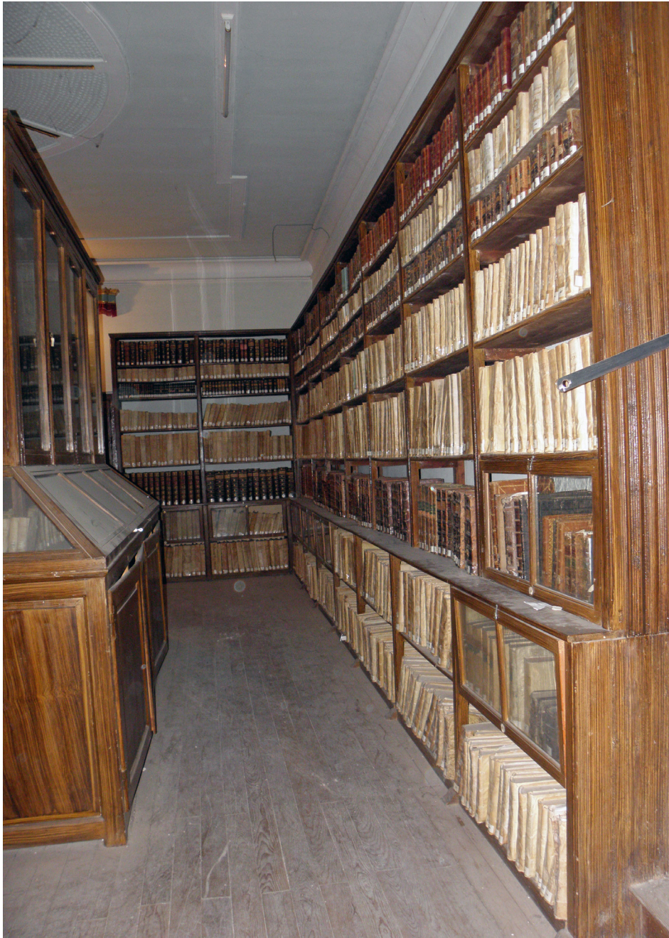
Figura 5. Archivo de la catedral de Burgo de Osma: vista interior de la Biblioteca.