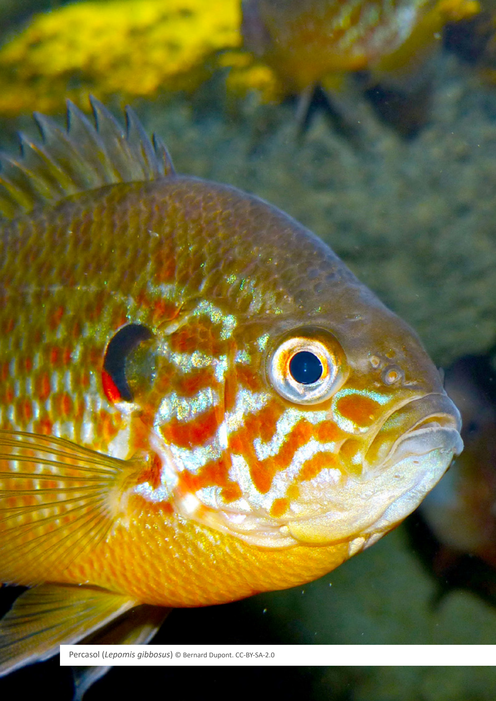
Percasol ( Lepomis gibbosus )