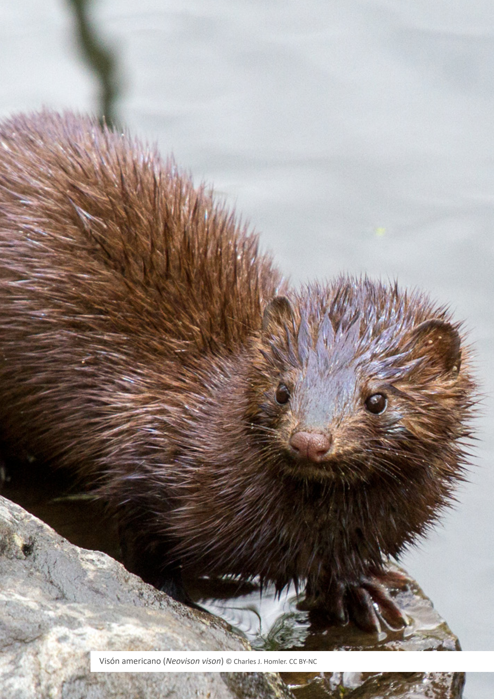
Visón americano ( Neovison vison ) © Charles J. Homler. CC BY-NC