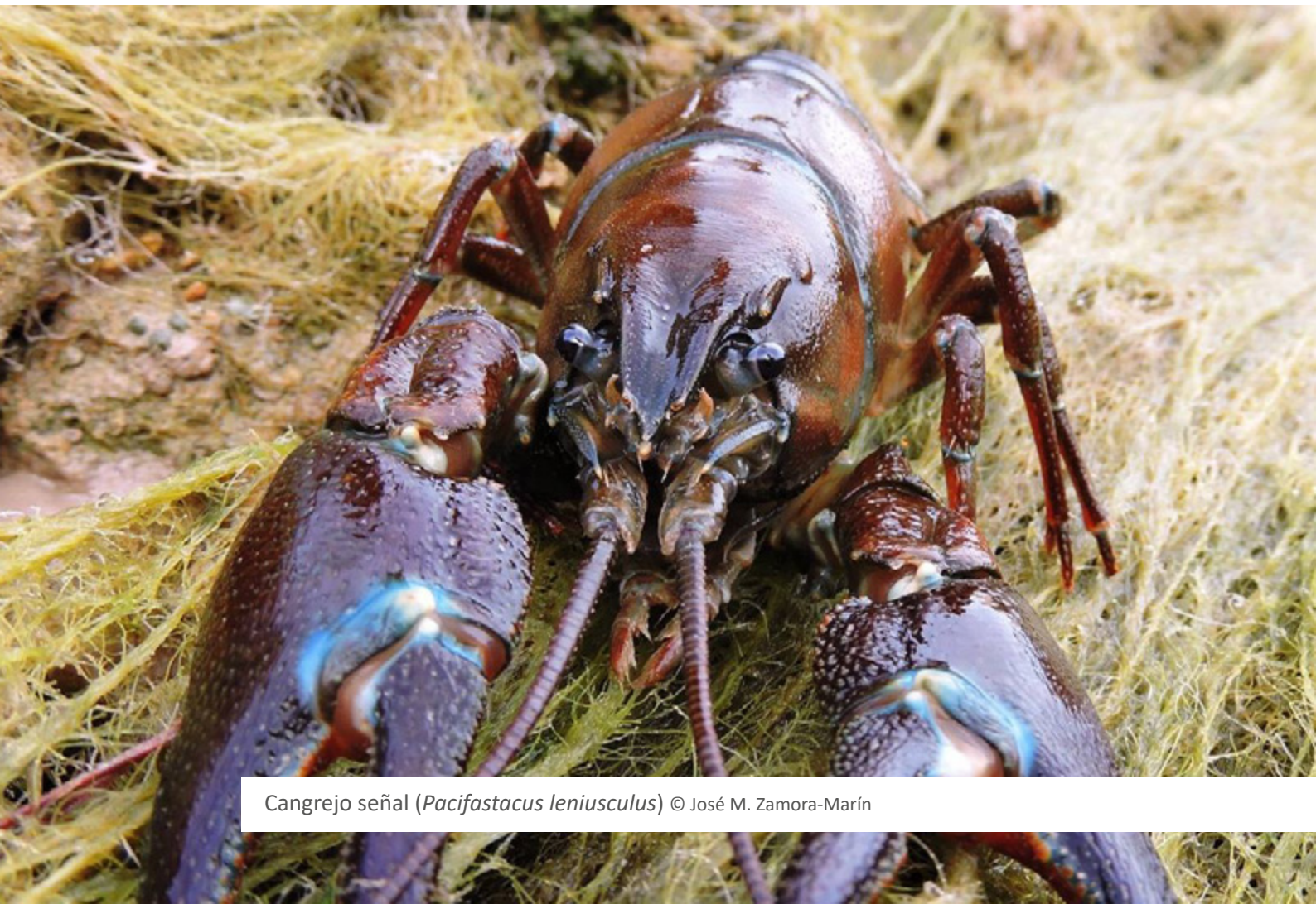
Cangrejo señal ( Pacifastacus leniusculus )

El proyecto LIFE INVASAQUA ha demostrado ser una buena fuente de información sobre las EEI en España y Portugal, apoyando la aplicación del Reglamento de la UE sobre las EEI mediante la generación de conocimiento, la participación y la creación de sinergias entre responsables de la gestión y partes interesadas. En este sentido, se invitará a Autoridades de España y de Portugal con competencia en la aplicación de la Regulación sobre EEI y a varias sociedades académicas a que comprueben y validen la Lista que aquí se presenta.