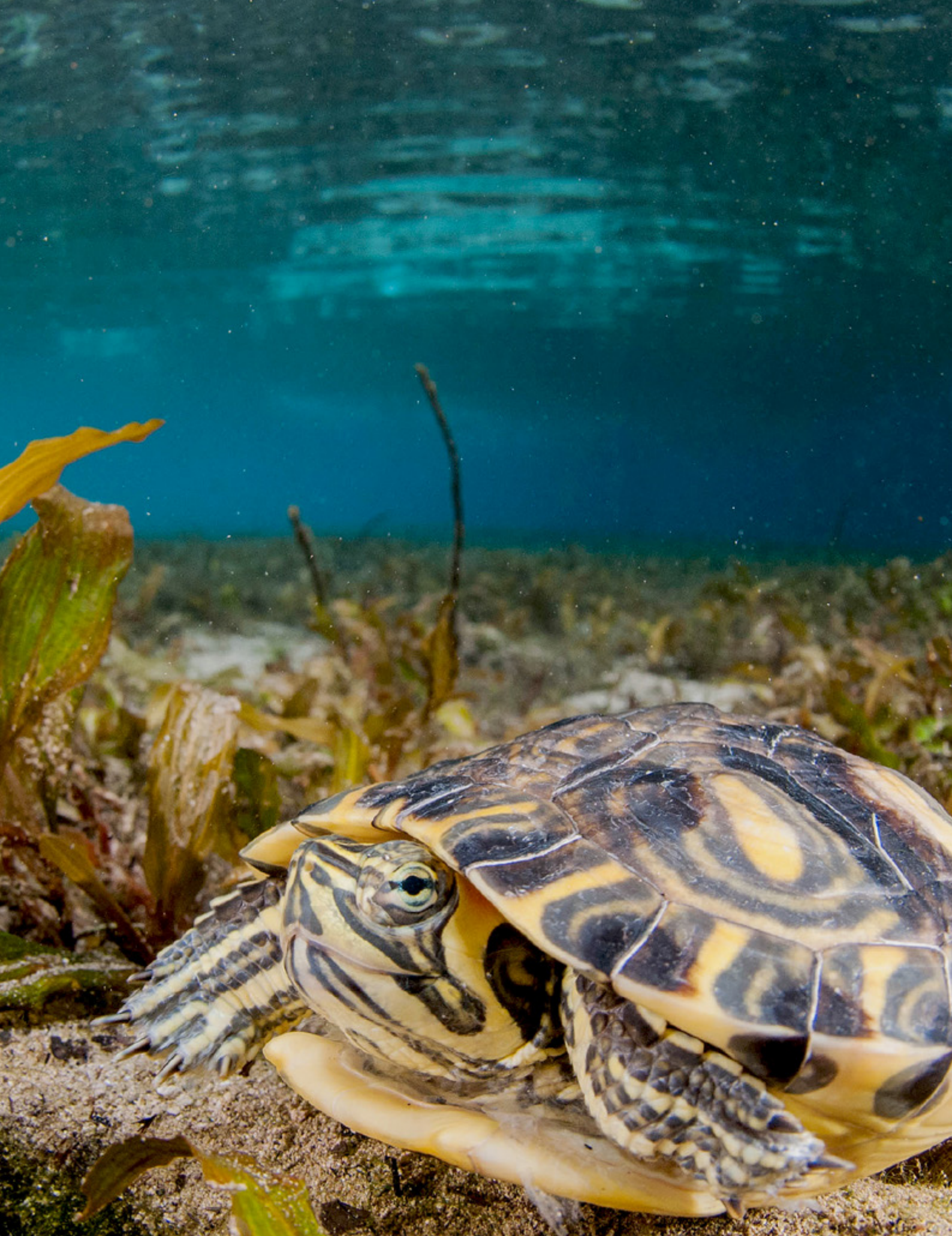
Tortuga de orejas rojas ( Trachemys scripta )