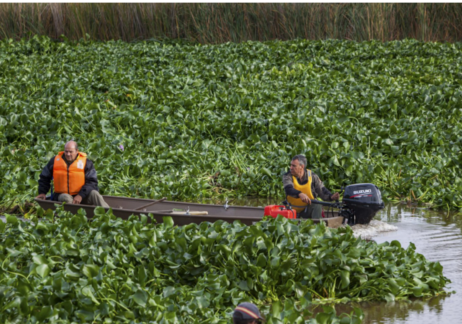
Camalote o Jacinto de agua ( Eichhornia crassipes).