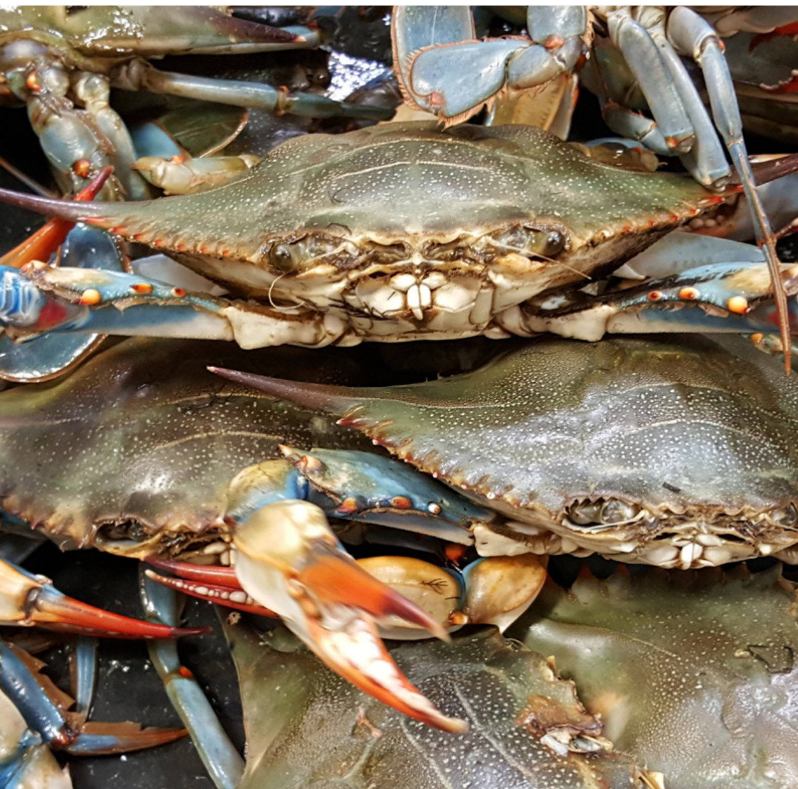
Cangrejo azul ( Callinectes sapidus )

Por último, cabe señalar que el objetivo del proyecto LIFE INVASAQUA, y por lo tanto de sus informes técnicos, es promover la colaboración y la coordinación con los encargados de la toma de decisiones y garantizar el intercambio y la puesta en común de los datos.