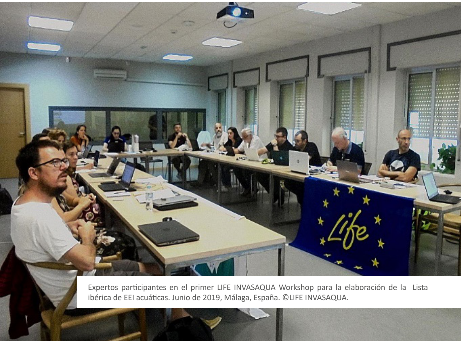
Expertos participantes en el primer LIFE INVASAQUA Workshop para la elaboración de la Lista ibérica de EEI acuáticas. Junio de 2019, Málaga, España.

El proceso de evaluación ha seguido un enfoque estructurado por etapas (CUADRO 2) que combina el conocimiento sobre las invasiones biológicas con la colaboración de expertos en la identificación y en la consolidación de resultados antes mencionada.