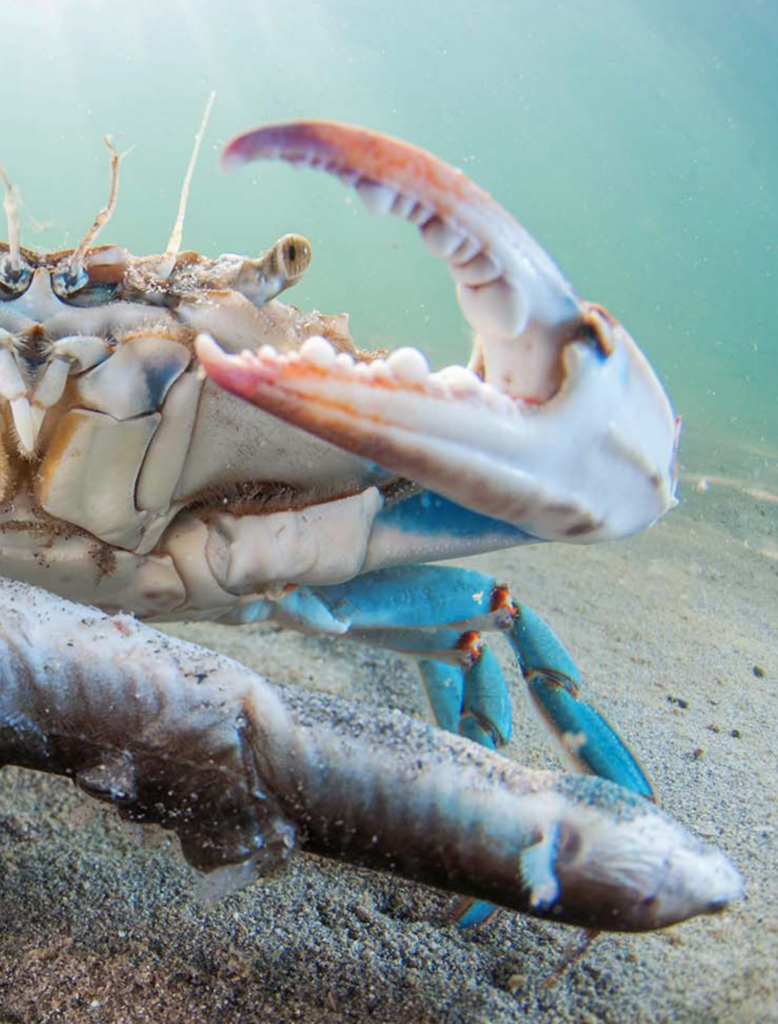
Cangrejo azul ( Callinectes sapidus )