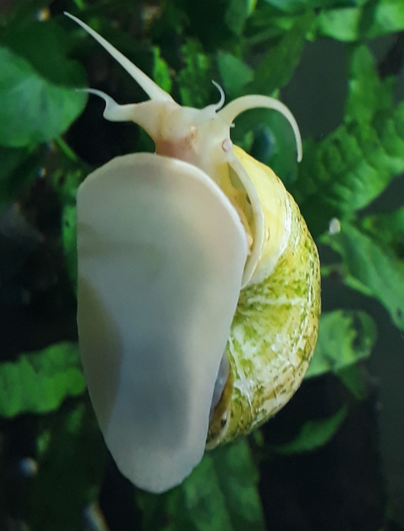
Caracol manzana ( Pomacea sp.)